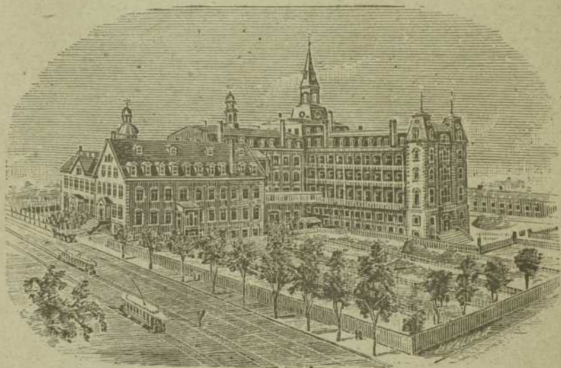
Institution des Sourdes-Muettes.