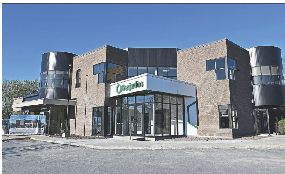
Les membres de la Caisse Desjardins du Haut-Richelieu ont maintenant accès aux nouveaux aménagements du siège social sur le boulevard d'Iberville.

La fin des travaux était prévue le 5 mai, mais les nouveaux aménagements étaient accessibles quelques jours auparavant. Cette rénovation a nécessité un investissement d'environ 2 M$. Ce montant inclut les travaux, le mobilier, les services professionnels, les imprévus et les taxes.