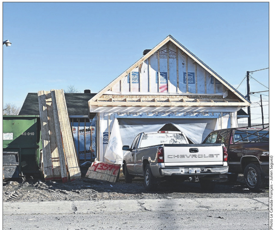
De janvier à avril, les demandes pour la construction d'un bâtiment accessoire comme un garage, un pavillon de jardin (gazebo) ou une pergola sont passées de 19 en 2019, 23 en 2020 à 144 en 2021.

De janvier à avril 2021, 152 demandes de permis de rénovation ont été reçues au SUEDD, comparativement à 92 en 2020 et à 95 en 2019 pour la même période. Ces