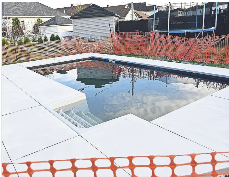
Depuis le début de l'année, 228 demandes de permis de piscine ont été reçues au Service de l'urbanisme. Il s'agit d'une hausse de 286,44 % par rapport à l'an dernier.