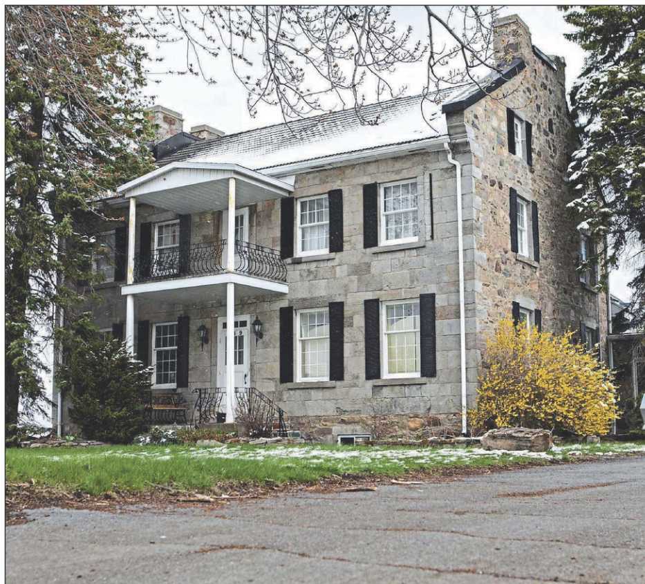
Autrefois, une galerie couverte longeait la façade principale en pierre de taille de l'hôtel relais. Il était courant à l'époque de privilégier les matériaux nobles pour le frontispice d'un édifice.

demeure du riche cultivateur offre un programme décoratif néoclassique où règnent l'ordonnance et la symétrie. Le corps massif de l'édifice est encadré par des murs coupe-feu en moellon, appuyés sur des corbeaux, qui sont prolongés par d'imposantes souches de cheminée.