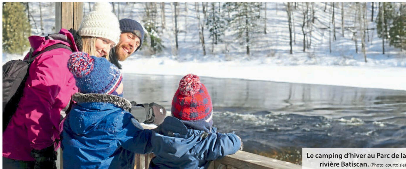
Le camping d'hiver au Parc de la rivière Batiscan.

D'autre part, les terrains de camping du