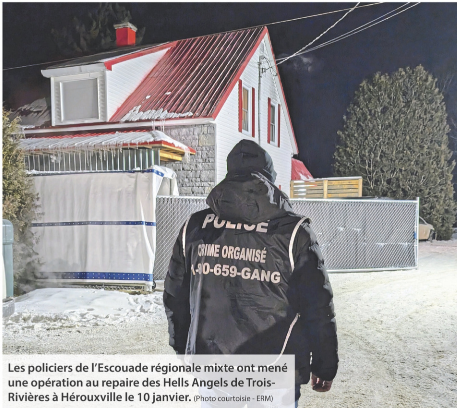
Les policiers de l'Escouade régionale mixte ont mené une opération au repaire des Hells Angels de Trois-Rivières à Hérouxville le 10 janvier.

HÉROUXVILLE. Les enquêteurs de l'escouade régionale mixte (ERM) ont procédé à des perquisitions en matière d'armes à feu le 10 janvier en soirée à Hérouxville au repaire des Hells Angels de Trois-Rivières.