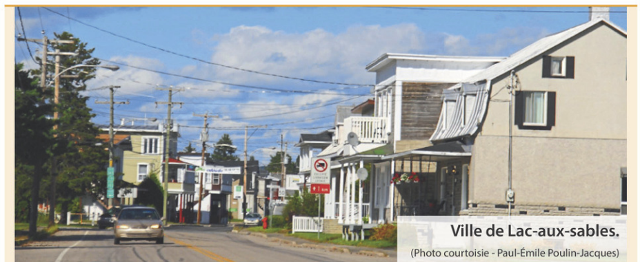
Ville de Lac-aux-sables.

Un total de 16 individus âgés de 27 à 71 ans se trouvaient dans le local de la bande de motards hors-la-loi. Il s'agissait de « membres en règle » des Hells Angels de Trois-Rivières, d'autres au statut de « prospect » et de membres de clubs supporteurs des Hells Angels. (M.E.B.A.)