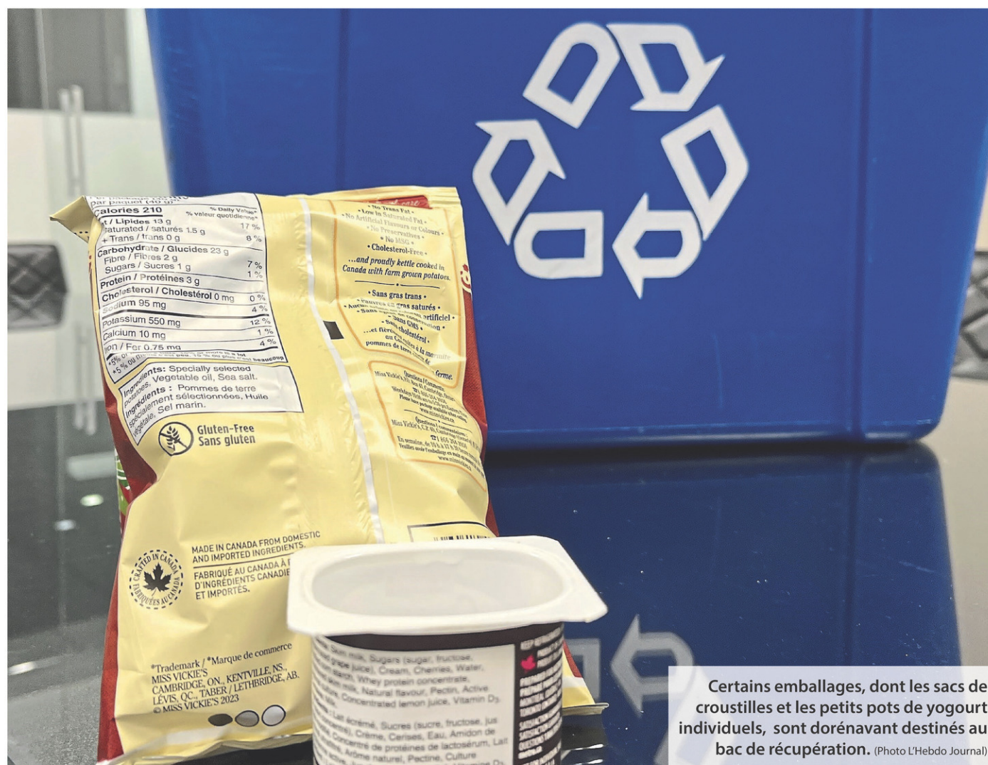
Certains emballages, dont les sacs de croustilles et les petits pots de yogourt individuels, sont dorénavant destinés au bac de récupération.

«On n'a pas fini de la marteler. Ce qu'Éco Entreprises Québec souhaite, c'est simplifier le geste de récupération pour le citoyen pour l'inciter à récupérer davantage. En simplifiant ainsi la