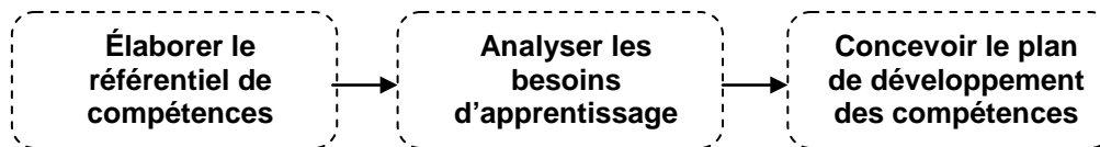
Figure 2 Du référentiel de compétences au plan de développement des compétences

Il faut rappeler que le référentiel de compétences est un outil nécessaire à la conception d'un plan de développement des compétences pour le RSPSAT. Comme le montre la figure 2, les informations du référentiel, en l'occurrence les ressources internes et externes, sont les données à partir desquelles seront réalisées les analyses de besoins de formation. Le résultat de ces analyses pourrait amener le national à développer un plan de formation axé sur les ressources transversales dans la mesure où l'analyse confirme des besoins de formation.