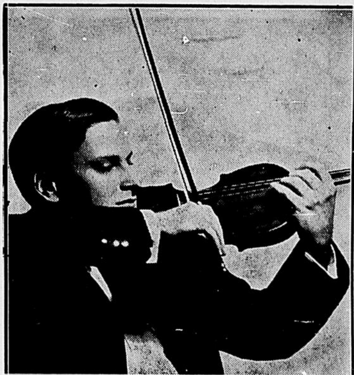
YEHUDI MENUHIN Au théâtre de Sa Majesté, lundi le 24 janvier