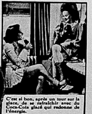
C'est si bon, après un tour sur la glace, de se rafraichir avec du Coca-Cola glacé qui redonne de l'énergie.