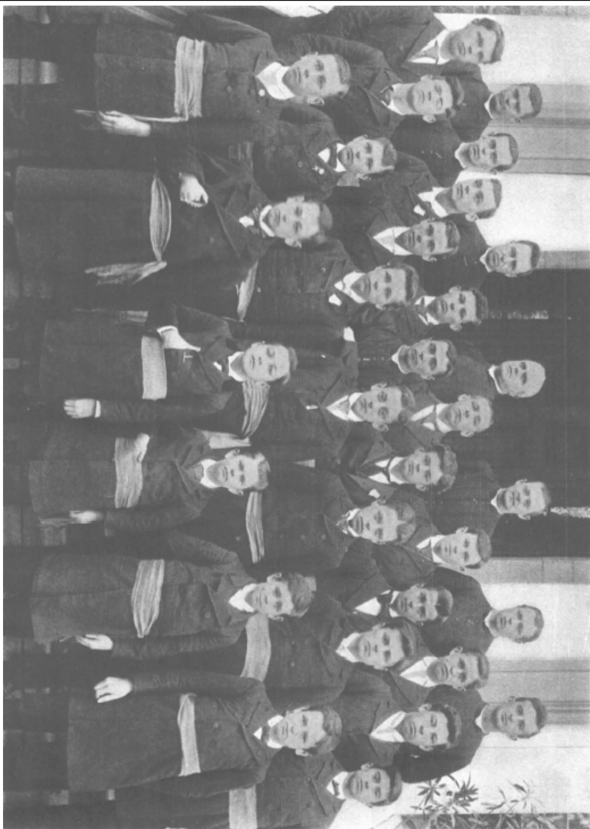
LE 61 e COURS, en MÉTHODE (1895-1896).