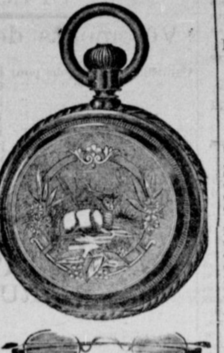
Le vrai moyen de s'enrichir