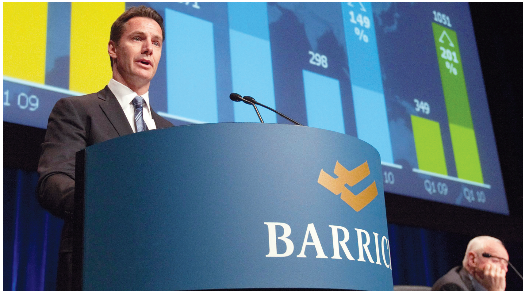
Le p.-d.g. de Barrick Gold, Aaron Regent, fut en 2009 le dirigeant d'entreprise canadien le mieux rémunéré avec des revenus de 24,4 millions, selon les calculs du Centre canadien de politiques alternatives. Le «groupe des 100» aurait gagné 155 fois le salaire moyen des travailleurs canadiens.