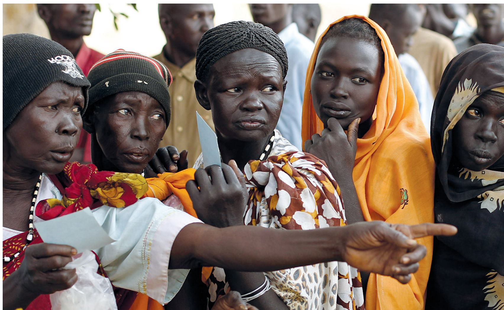
Des réfugiés revenus récemment au Sud-Soudan attendent patiemment les vivres distribués par le Programme alimentaire mondial dans le camp de Wanjak, dans la province de Bahr el-Ghazal. Un référendum sur l'indépendance du Sud-Soudan doit avoir lieu le 9 janvier prochain.

Mais nous pouvons et nous devons faire beaucoup plus. La décision canadienne d'appuyer l'élimination de la Brigade de secours de Haute-Promptitude, une force multinationale de maintien de la paix à réaction rapide, a empêché la possibilité d'un prompt renfort provenant des Nations unies à l'intérieur de cette zone de conflit lors de cette période instable. Le Canada aurait dû lutter pour la viabilité des capacités de cette force militaire multilatérale. Reconnu comme une puissance