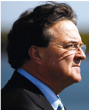
SHAUN BEST REUTERS

«Et assurément, le plan pour les infrastructures, tout comme les diverses réductions d'impôt, semblent rétrospectivement avoir porté leurs fruits et contribué à soutenir la reprise.»