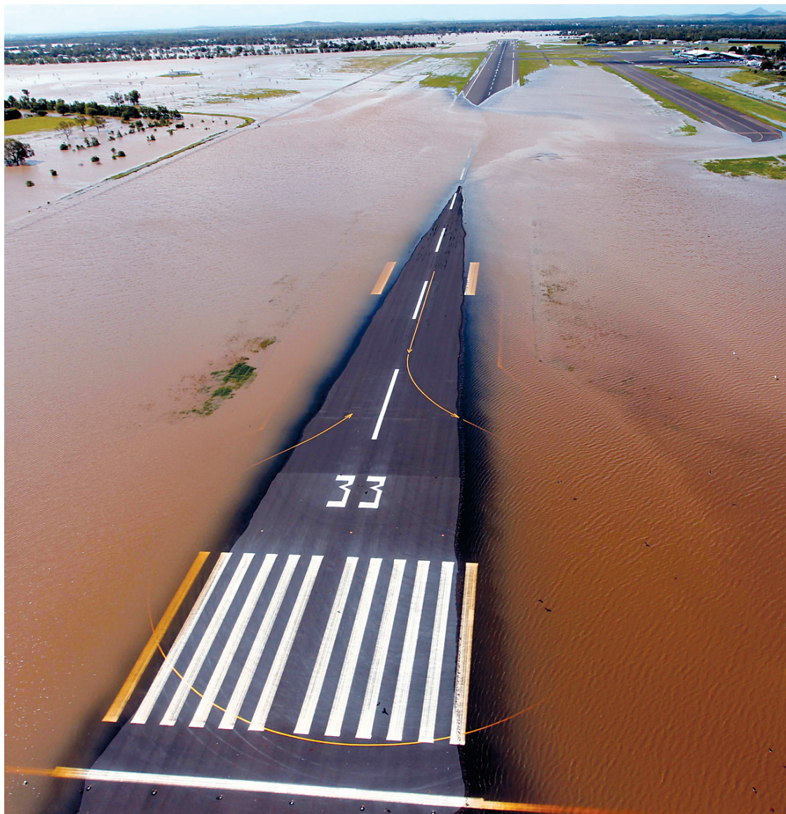
L'eau a recouvert la piste d'atterrissage de la ville de Rockhampton, en Australie. Les pluies diluviennes qui ont commencé avant Noël ont inondé une zone grande comme la France et l'Allemagne réunies dans l'État du Queensland, dans le nord-est de l'Australie.