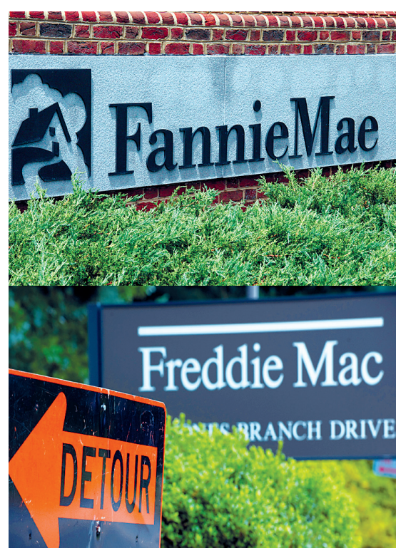
Les géants du marché immobilier américain, Fannie Mae et Freddie Mac

Mais il se refuse à trancher entre ces possibilités, qui ont de graves inconvénients selon lui. Ce sera le travail des parlementaires, généralement peu pressés d'aller dire à leurs électeurs qu'ils vont se battre pour que l'État aide moins les candidats à un achat immobilier.