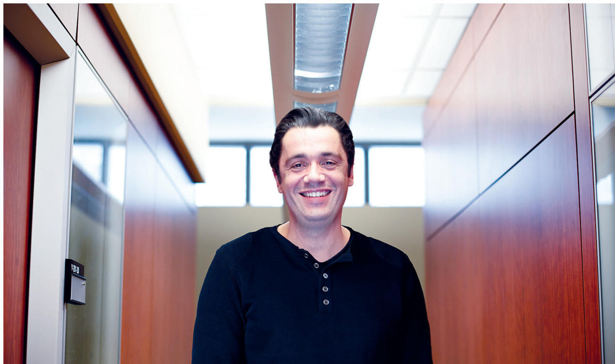
JEAN-FRANÇOIS HAMELIN LE DEVOIR

Cet échange est-il possible dans un contexte de pénurie comme le nôtre? «C'est sûr que, dans le cadre actuel, cela peut paraître très complexe et très énergivore. Mais en fin de compte, il y a beaucoup d'études qui sont en train de démontrer qu'à partir du moment où le processus de décision est partagé,