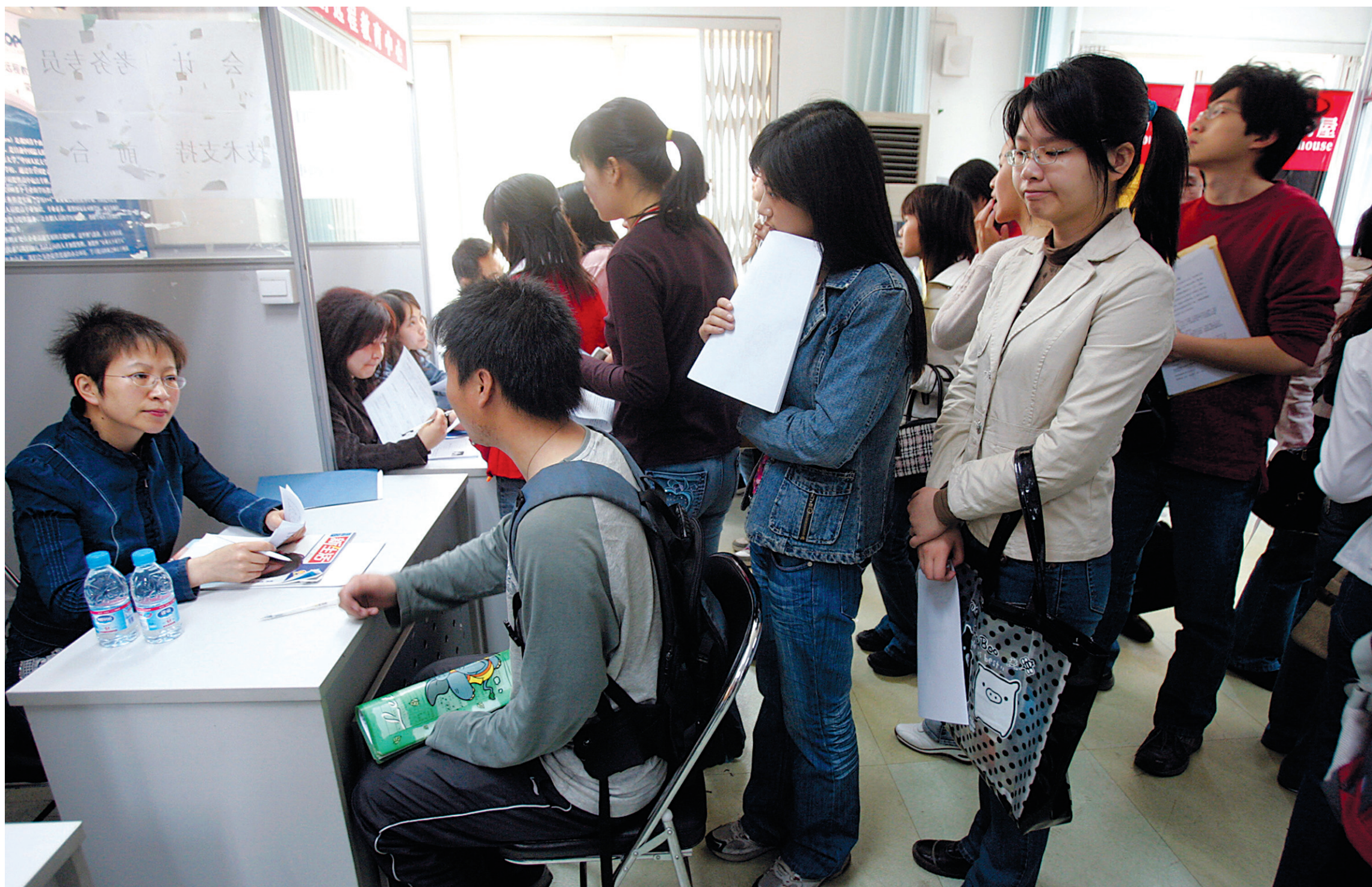
De jeunes travailleurs chinois font la file dans une foire à l'emploi. Selon les statistiques officielles, 27,8 % des jeunes diplômés sont sans emploi.