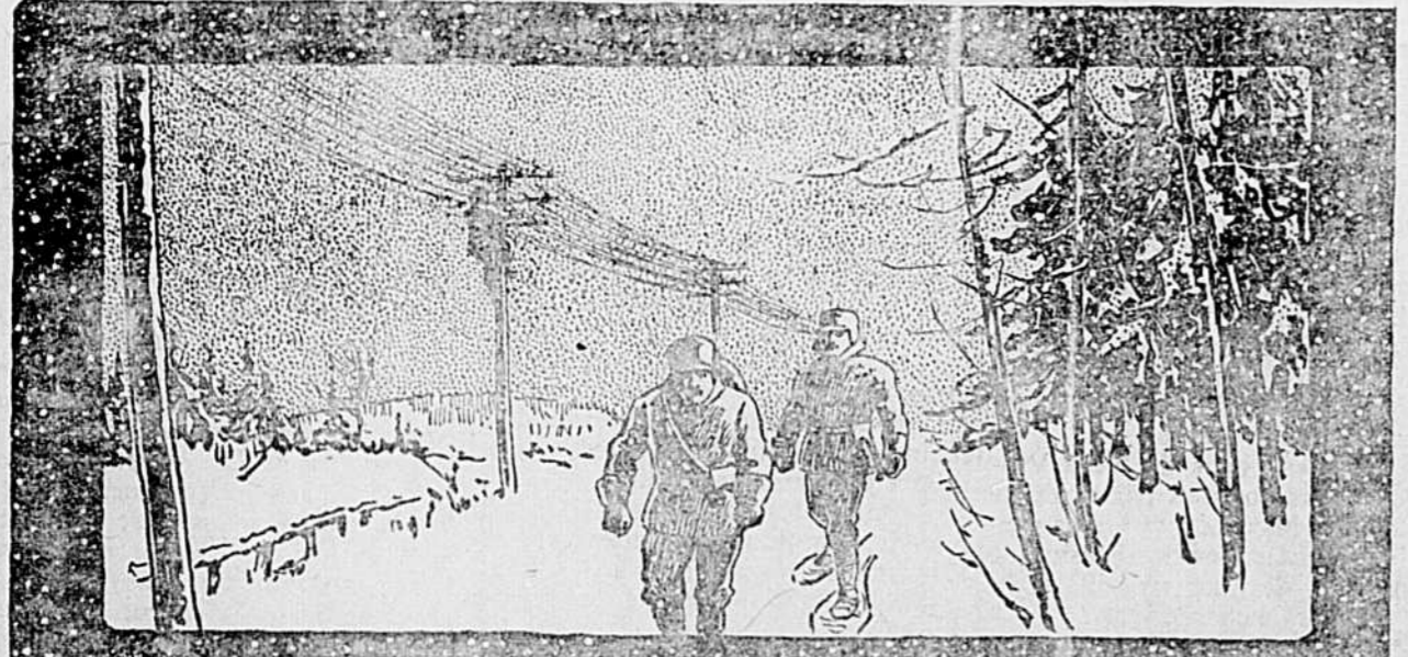
Service vicinal de la Cie de Téléphone Bell—Maintien des lignes de communication en hiver. Le Crown de Macdonald est le plus précieux auxiliaire des travailleurs en plein air.