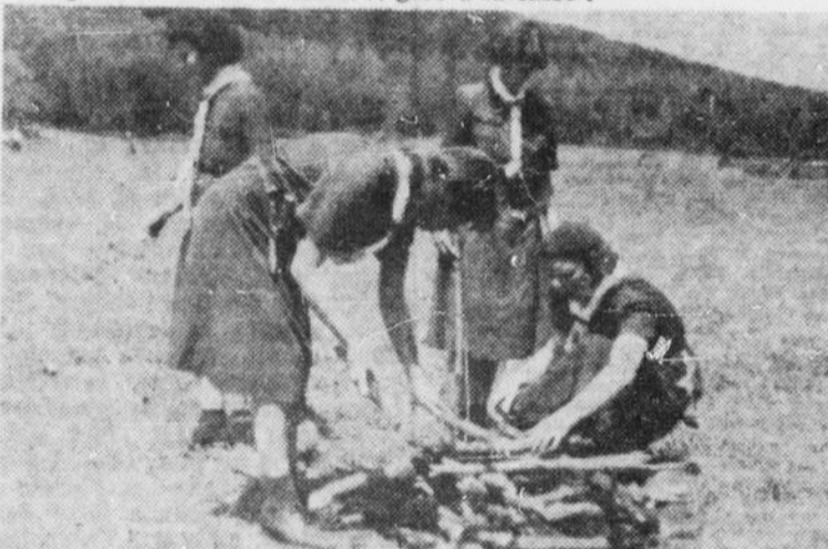
Les Guides de Maniwaki, "première compagnie Notre-Dame de l'Assomption", passent récemment un semaine de vacances sur les bords du Lac Grenon. Sur la photo ci-dessus, quatre jeunes filles apprennent leur dîner champêtre.