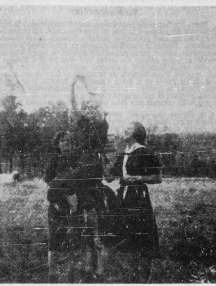
Quatre Guides de Maniwaki, en colonie de vacances au Lac Grenon, près de Messines, construisent une arche à l'entrée de leur camp. Si le cheval se cabre... gare à la casse!