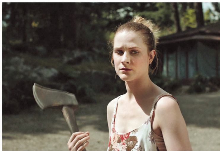
Durant toute la première partie du film, Evan Rachel Wood (notre photo) et sa collègue Ellen Page apparaissent sous-utilisées.