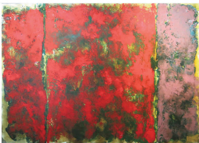
Jean McEwen, "Cages d'île n°3"

Importante exposition Maîtres Québécois : Alleyn, Ferron, Gagnon, Hurtubise, Lemieux, McEwen, Riopelle, Suzor-Côté