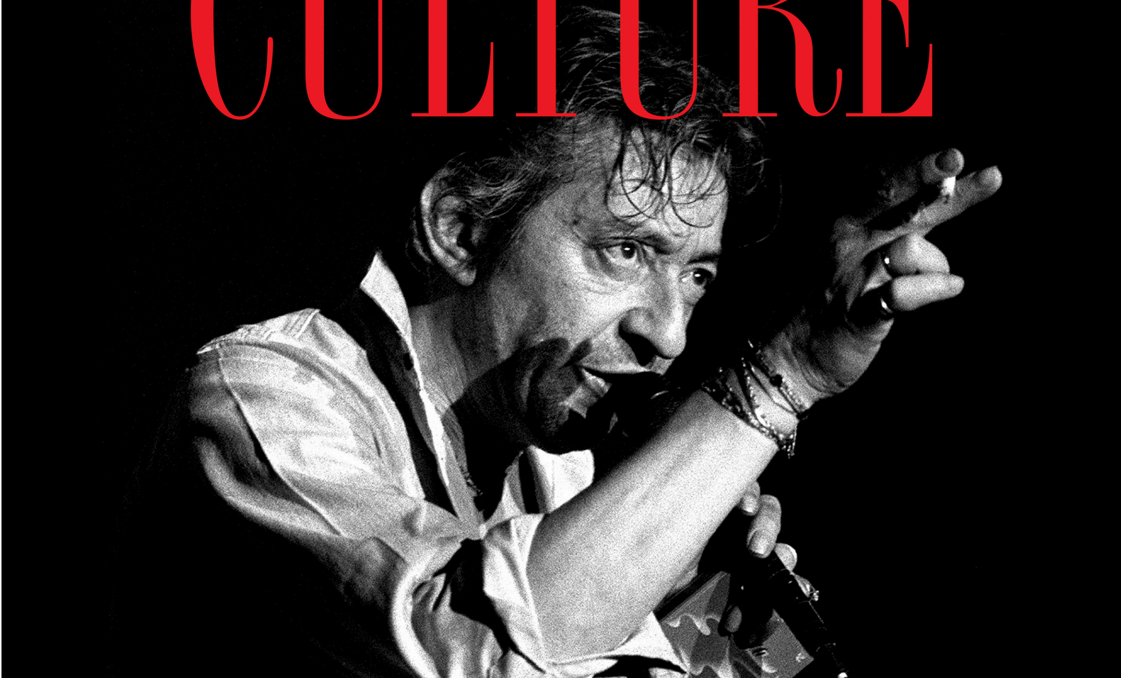
Serge Gainsbourg en concert lors du Printemps de Bourges, le 3 avril 1986