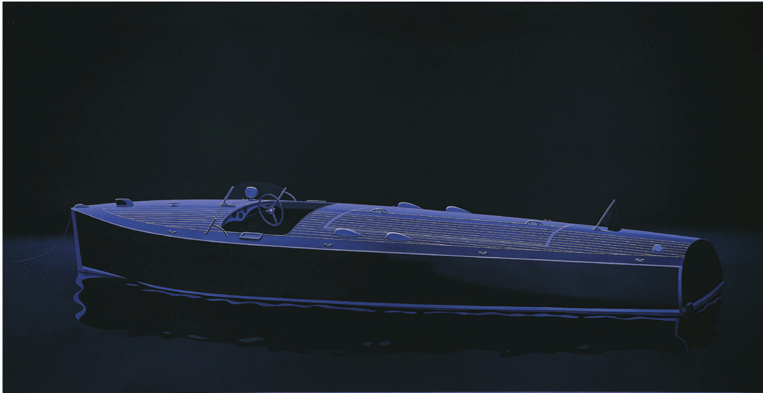
Edmund Alleyn, L'invitation au voyage , 1989-1990

COLLECTION DU MUSÉE DES BEAUX-ARTS DE MONTRÉAL