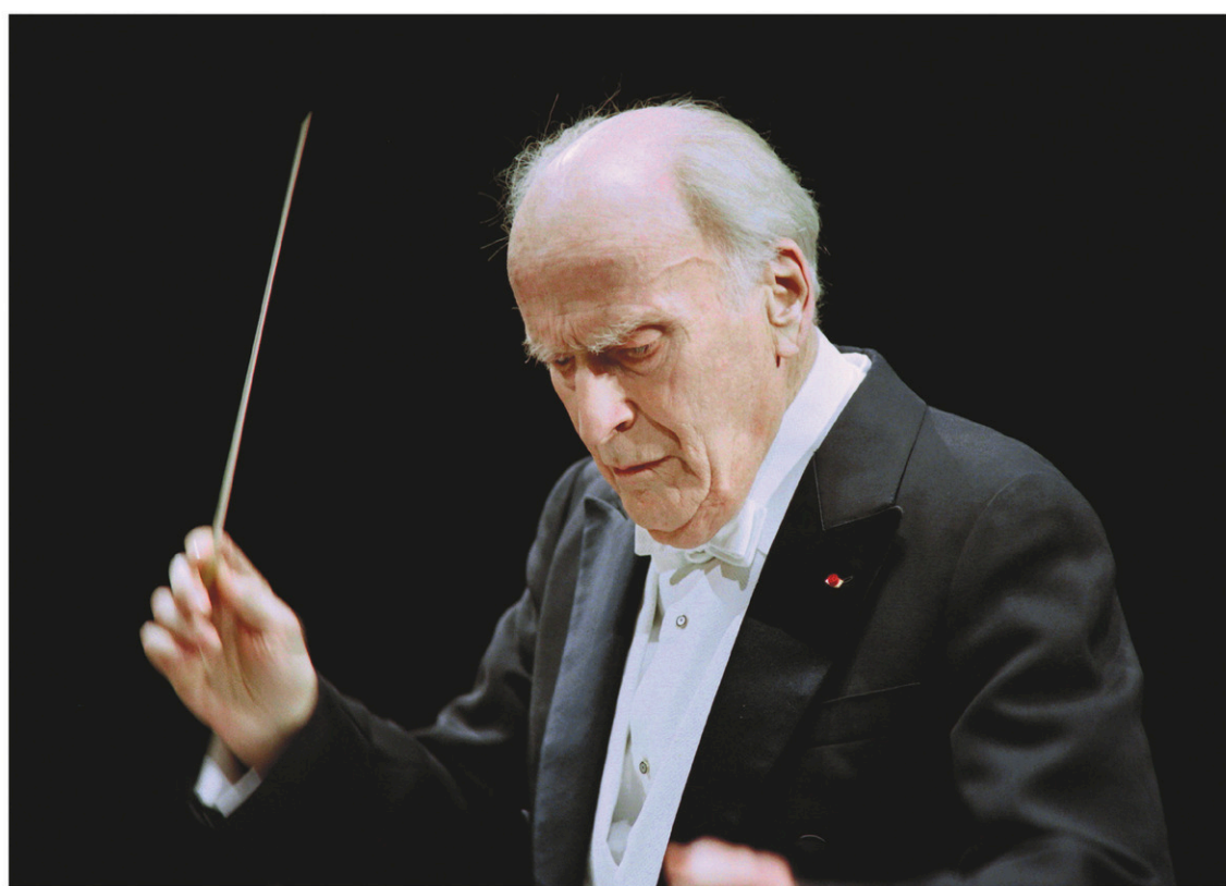
Menuhin, né en 1916, fut l'un des plus grands phénomènes parmi les instrumentistes du XX e siècle.