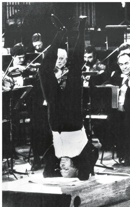
Yehudi Menuhin, tête en bas, conduisant — avec les pieds! — le Philharmonique de Berlin

«En juin 1945, se réunit à San Francisco la Conférence générale des Nations unies qui abou-