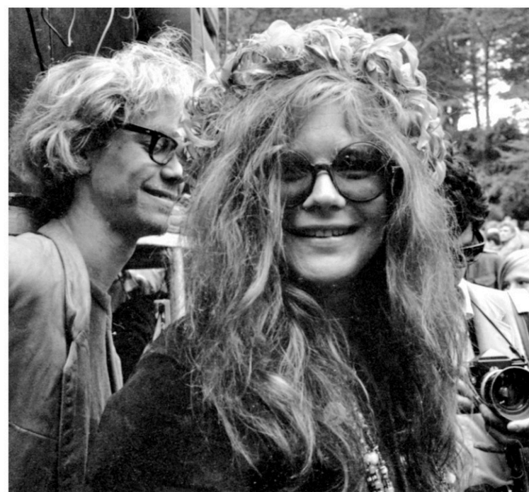
CINÉMA DU PARC Le film est aussi une plongée dans le Flower Power, dont Janis Joplin fut une égérie vibrante, enflammée, un tison éphémère.

Cette admiratrice de la grande Bessie Smith aura car-