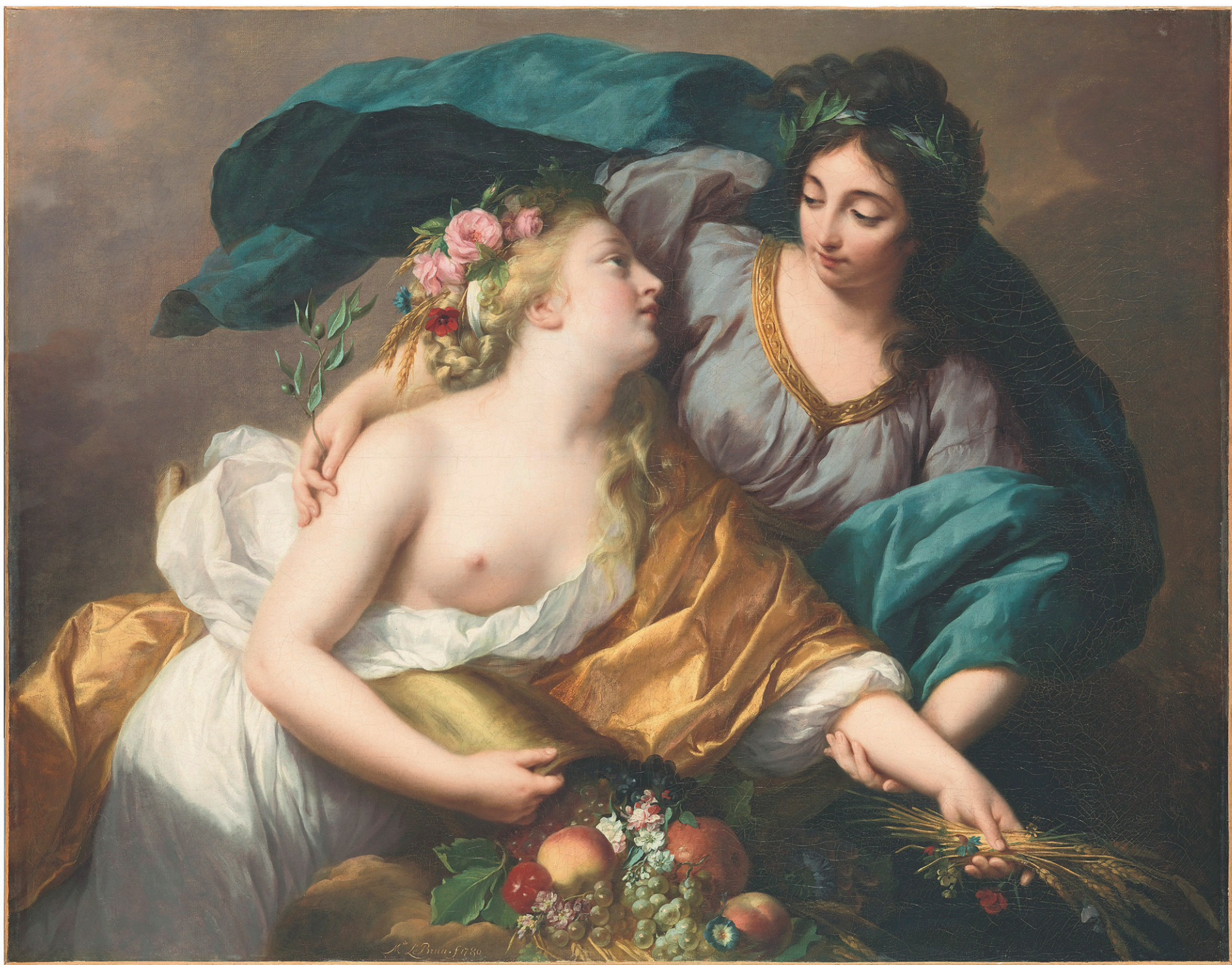
La Paix ramenant l'Abondance (1780)