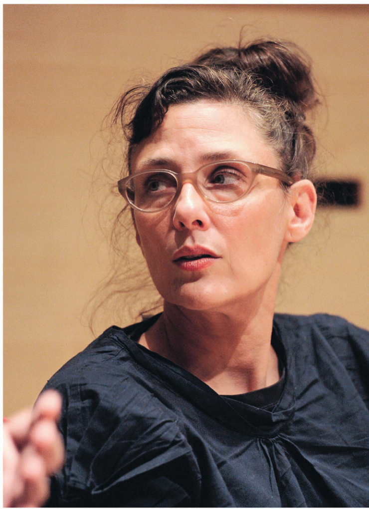
Rebecca Miller reconnaît qu'il y a une part d'elle dans chaque personnage de son film Maggie's Plan .

Trois ans plus tard, parents d'une fillette, Maggie et John voient le train-train quotidien tuer peu à peu leur couple. Opiniâtre de nature, Maggie confie à ses amis qu'elle veut rabibochoer John et Georgette. « Je crois que Maggie voit sa vie comme un roman, mais elle réalise qu'elle n'y est qu'un