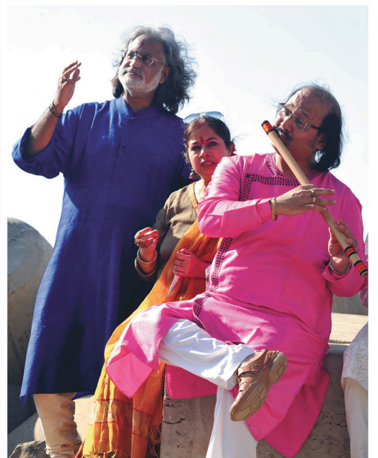
Ronu Majumdar (à droite) en concert improvisé à Mumbai, en 2015, avec Mohan Veena et Vishwa Mohan Bhatt.

À la salle Bourgie, samedi 4 juin à 19 h