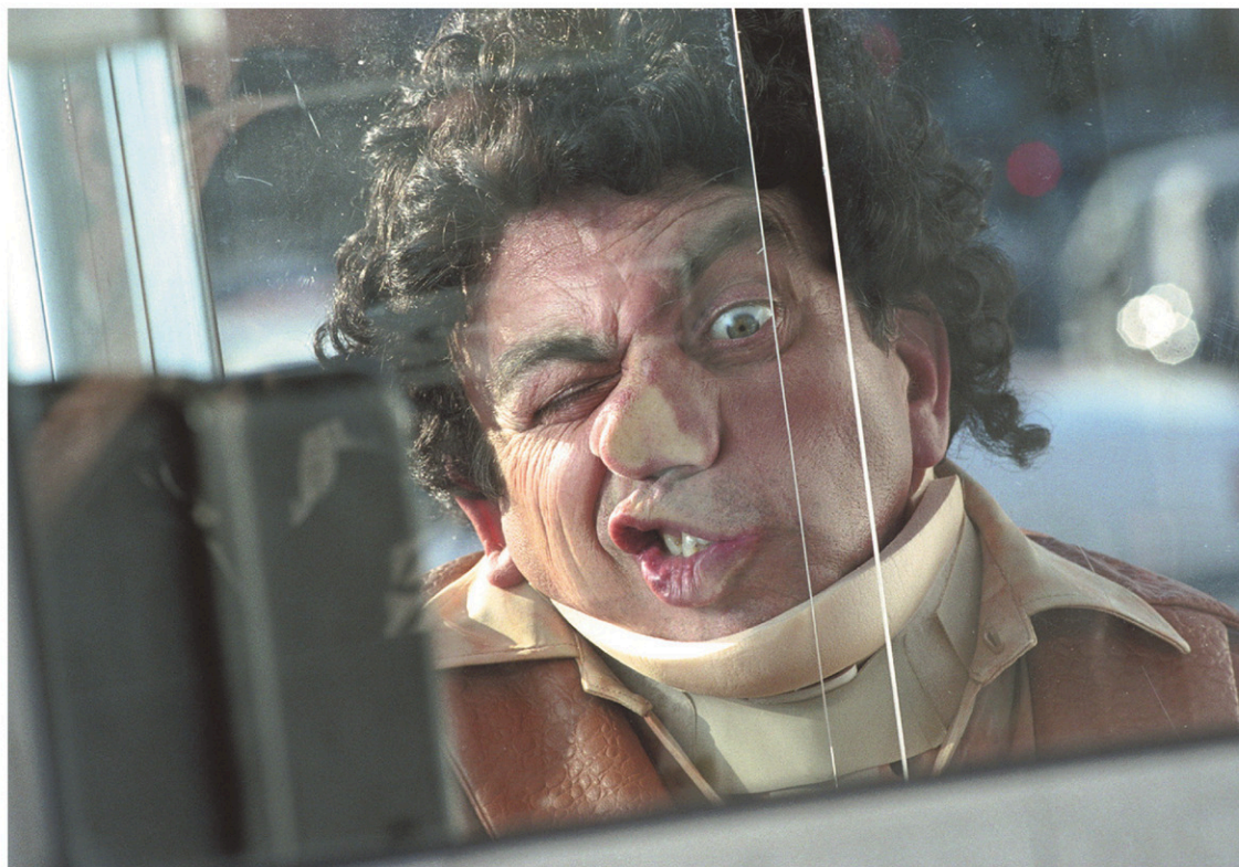
Elvis Gratton, mis au monde dans les années 1980 par Pierre Falardeau et Julien Poulin, a longtemps ravi le public québécois et fait hurler la critique.

Ironie du sort, cette caricature à grands favoris allait ravir le cœur des Québécois. Au grand dam de Falardeau. Il eut beau offrir à ses premières incarnations des suites immondes, le jeter dans la merde jusqu'au cou, lui faire lécher les pieds des riches et des puissants, la critique hurlait. Pas grave! Son public suivait.