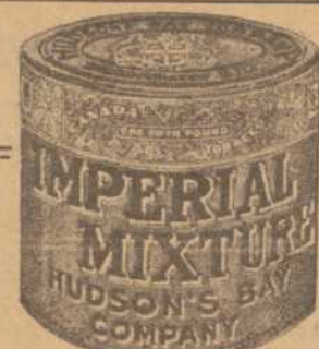
"Canada's Most Famous Tobacco"

Rédaction et administration: 9 et 11 rue Saint-Paul Ouest.