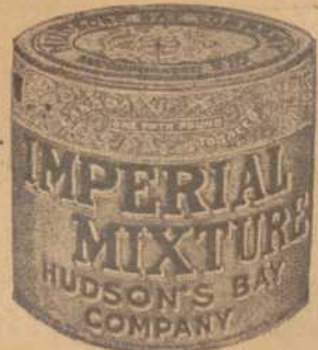
"Le plus fameux Tabac au Canada"