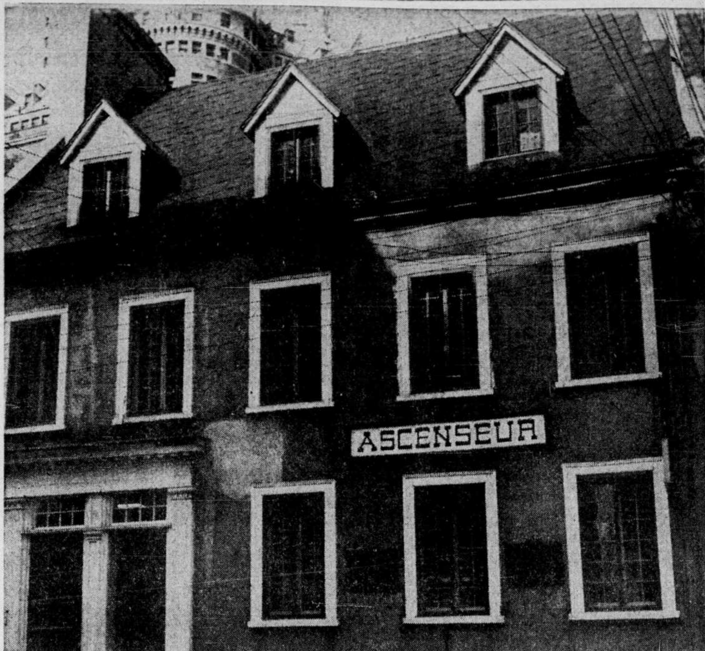
La maison de Louis Joliet. Bâtie en 1683 pour le célèbre explorateur, elle l'abrita avec sa famille jusqu'à sa mort qui survint en 1700.

Ligue Américaine New-York à Detroit (soir) Washington à Cleveland (soir) Baltimore à Chicago (soir)