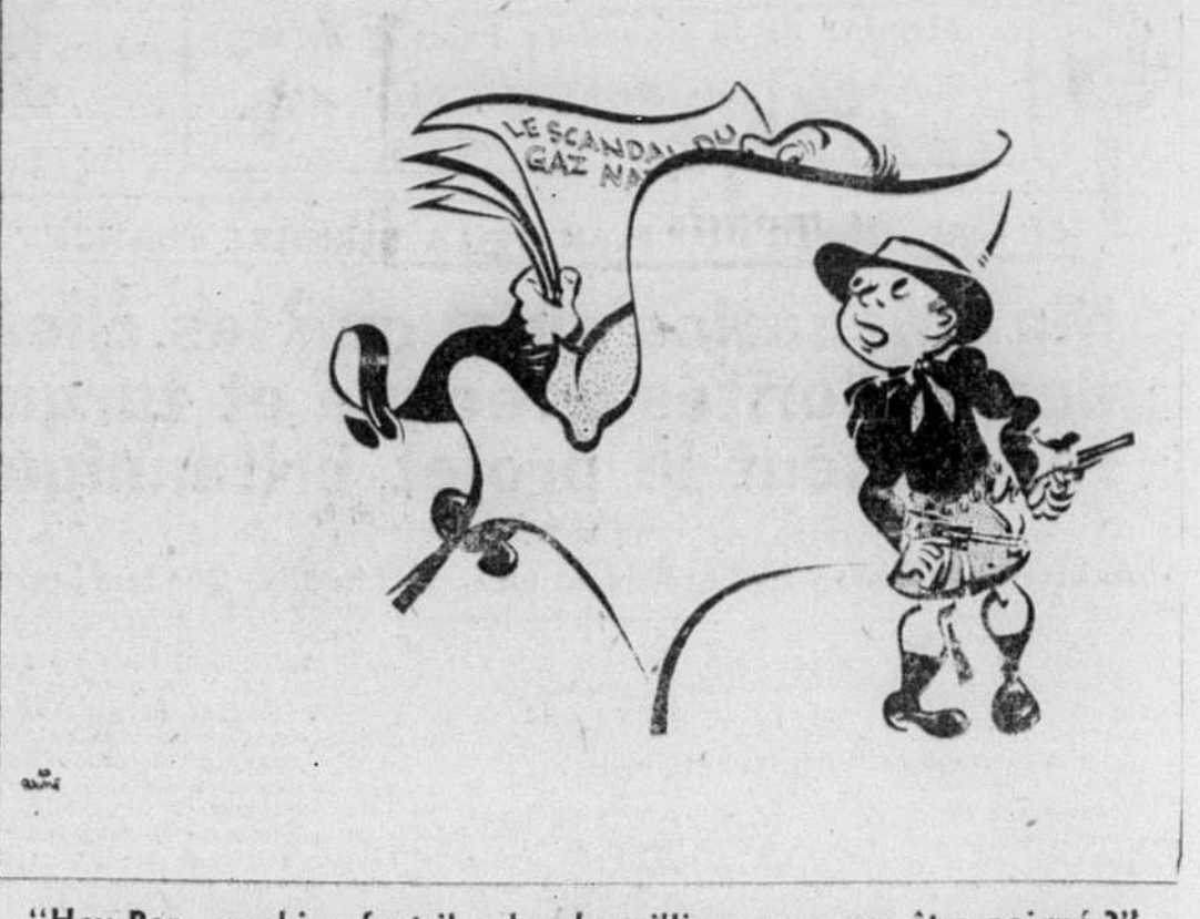
"Hey Pop, combien faut-il voler de millions pour pas être poigné?"