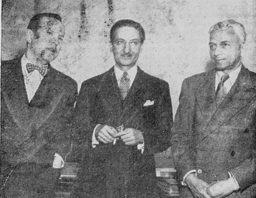
M. Lester B. Pearson, Ministre des affaires étrangères du Canada, M. Nashrollah Entizam, Président de l'Assemblée générale et Ambassadeur d'Iran, et Sir Benegal Rau, Représentant permanent de l'Inde auprès des Nations Unies (de gauche à droite), ont été chargés par l'Assemblée générale de l'ONU de rechercher les bases d'un accord en vue de la cessation des hostilités en Corée.