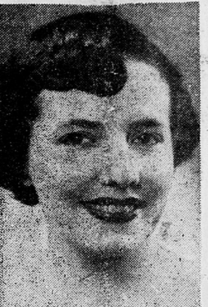
Marthe Lapointe, la célèbre artiste de l'opérette et du théâtre, qu'on entendra, Coup de Clairon, le programme de l'Armée que le réseau français de Radio-Canada diffusera à 8.30 h., du soir, jeudi le 25 janvier.

Le "Théâtre lyrique Molson" présentera, lundi soir prochain 22 janvier, l'opérette romantique de Franz Lehár "Le pays du sourire". Cette opérette, lorsqu'elle fut présentée à Paris, garda l'affiche pendant sept saisons consécutives. Le "Théâtre lyrique Molson", commandité par Molson's, est radiodiffusé tous les lundis soirs, de 9h. à 10h. sur les ondes du réseau français de Radio-Canada. Les principaux interprètes du "Pays du sourire", lundi soir, seront Pierrette Alarie et Léopold Simoneau.