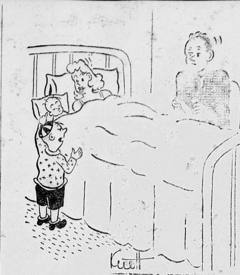
Voulez-vous me dire que c'est la grande surprise ?

évidemment un problème international. Pour l'acier, la pénurie de plus en plus sensible aux Etats-Unis, et le système de contrôles qui en est résulté, a limité les achats canadiens outre-frontière et nécessité le contrôle de la distribution au Canada. Bien qu'on construise des aciéries nouvelles aux Etats-Unis et qu'on entreprenne au Canada un programme additionnel d'expression, ces projets demandent beaucoup de temps et dans l'interim, la consommation de l'acier par les industries de défense va continuer de se développer encore.