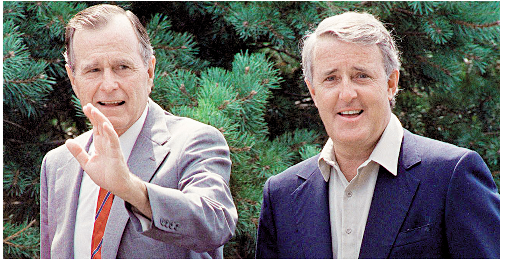
George Bush et Brian Mulroney, les deux signataires de l'Accord de libre-échange entre les États-Unis et le Canada

Comme quoi il n'y a pas que la compétence économique qui décide du résultat d'une élection, et cette image de compétence n'est souvent pas là où l'on croit.