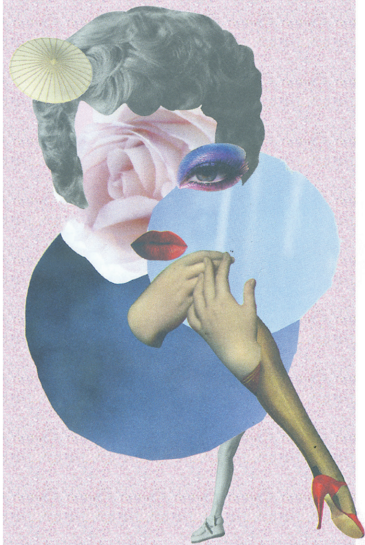
ILLUSTRATIONS TIRÉES DU LIVRE BEAUTÉ, HISTOIRE, FLORILÈGE ET ASTUCES