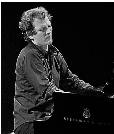
Brad Mehldau

Nous aurons eu droit à une conversation délicate, aux antipodes de l'ostentation, dialogue qui a d'ailleurs requis quelques ajustements au départ, et qui n'a cessé de s'améliorer afin qu'on puisse conclure à une rencontre concluante.