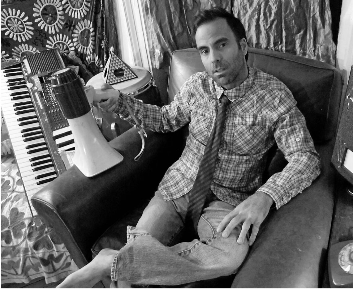
David Binney est un improvisateur de très haut niveau, son jeu au saxophone alto en exprime un maximum de possibilités

Binney est un improvisateur de très haut niveau, son jeu au saxophone alto en exprime