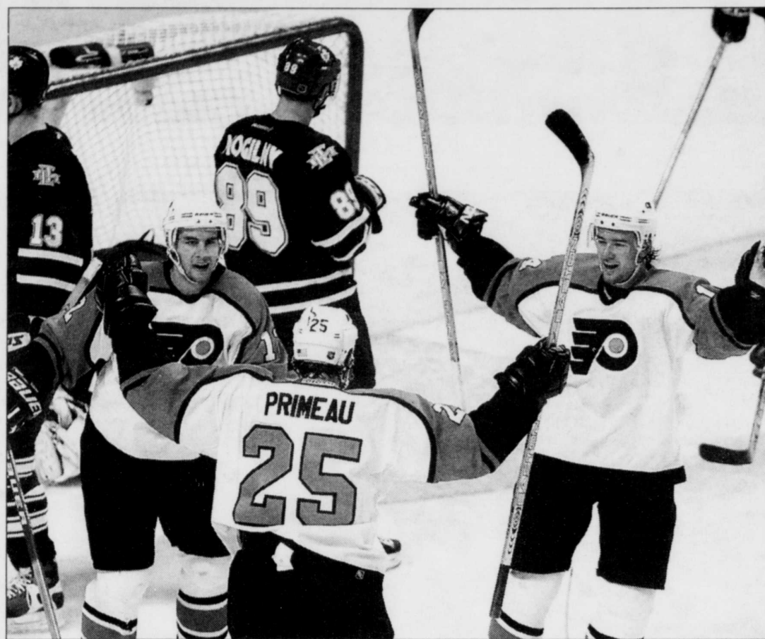
Keith Primeau a marqué le troisième but des Flyers en deuxième période, contribuant à l'éclatante victoire de 6 à 1 contre les Maple Leafs.

L'homme d'affaires torontois Eugene Melnyk est confiant de voir la Ligue nationale de hockey approuver son offre d'achat des Sénateurs d'Ottawa. Melnyk s'attend à être fixé au début du mois de mai. «Nous souhaitons compléter la transaction d'ici les deux prochaines semaines, a confié Melnyk, en rappelant qu'il avait toujours l'intention de garder l'équipe dans la capitale fédérale. (PC)