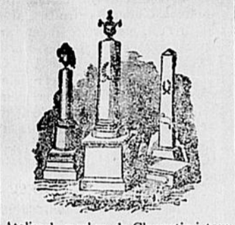
Atelier de marbre de Chicoutimi tenu par

MAITRE-CHARRETIER AVENUE BÉGIN, CHICOUTIMI Voitures à louer Représentant de cinq compagnies pour la vente de voitures en tous genres, d'hiver d'été. Instruments aratoires de la célèbre compagnie NOXON. AUSSI MOULINS À BATTRE AVEG OU SANS VANNEAUX CONDITIONS FACILES Téléphone: 76.