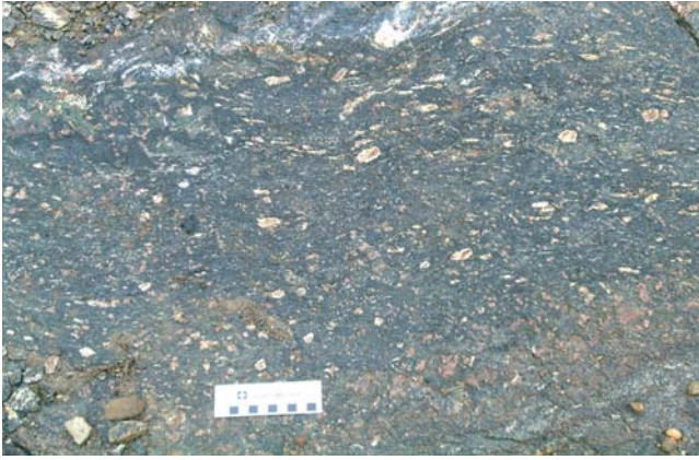
Photo 1 - Métabasalte de l'unité V3Ba contenant des reliques de phénocristaux de plagioclase recristallisés avec une texture grano-blastique. Le cœur de ces reliques de phénocristaux sont riches en grenat.