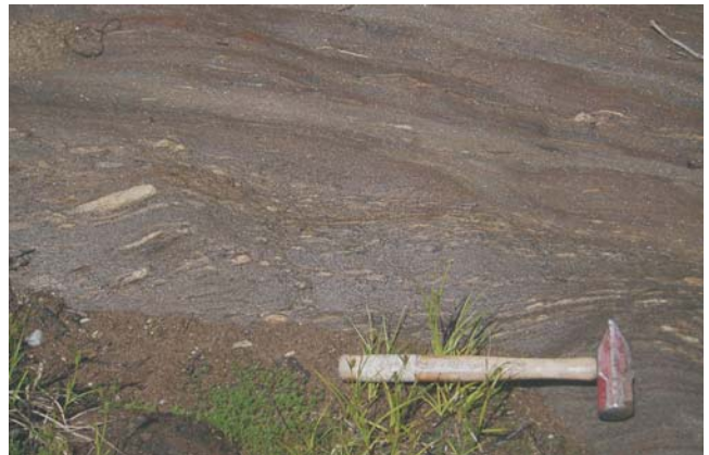
Photo 6 - Ancien litage transposé dans une zone de déformation orientée ENE. Ce litage est composé d'une alternance de lits décimétriques de wacke et de conglomérat. Notez, dans le conglomérat, la forme des fragments étirés en cigare.