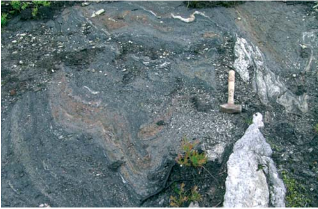
Photo 3 - Horizon de gneiss à grenat dans les métabasaltes de l'unité V3Ba. Les horizons de gneiss à grenat (grenatite), plus compétents, sont plissés, boudinés et démembrés.