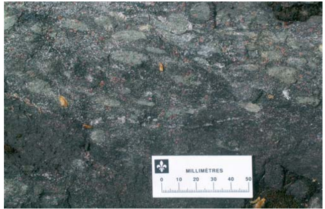
Photo 2 - Métabasalte à grenat de l'unité V3Ba illustrant la texture ocellaire composée d'amas sub-arrondis de clinopyroxène poeciloblastique.