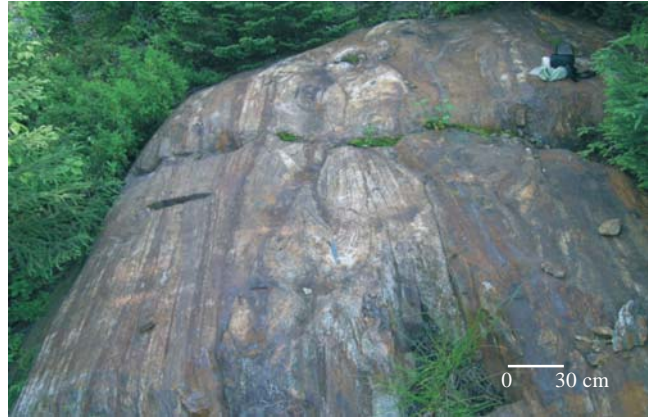
Photo 4 - Exhalite composée d'horizons de chert laminé et de formations de fer sulfurées. L'horizon de chert est affecté par des plis isoclinaux déracinés.