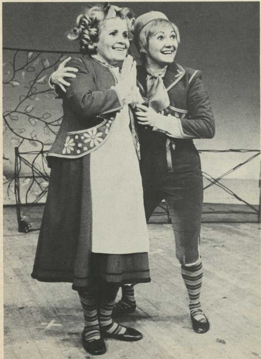
Mytyl — Tytyl