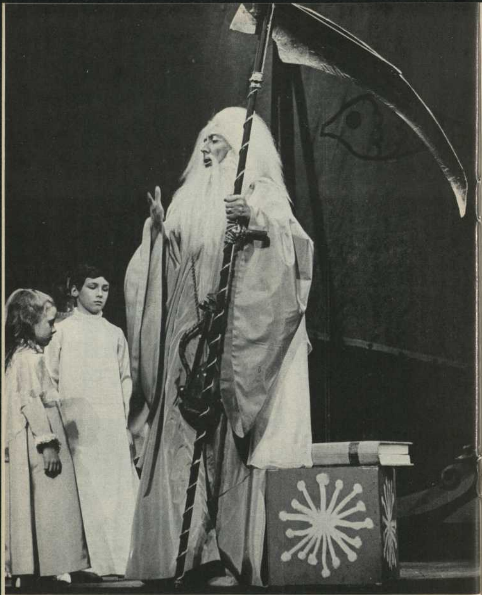
Le Temps au Royaume de l'Avenir