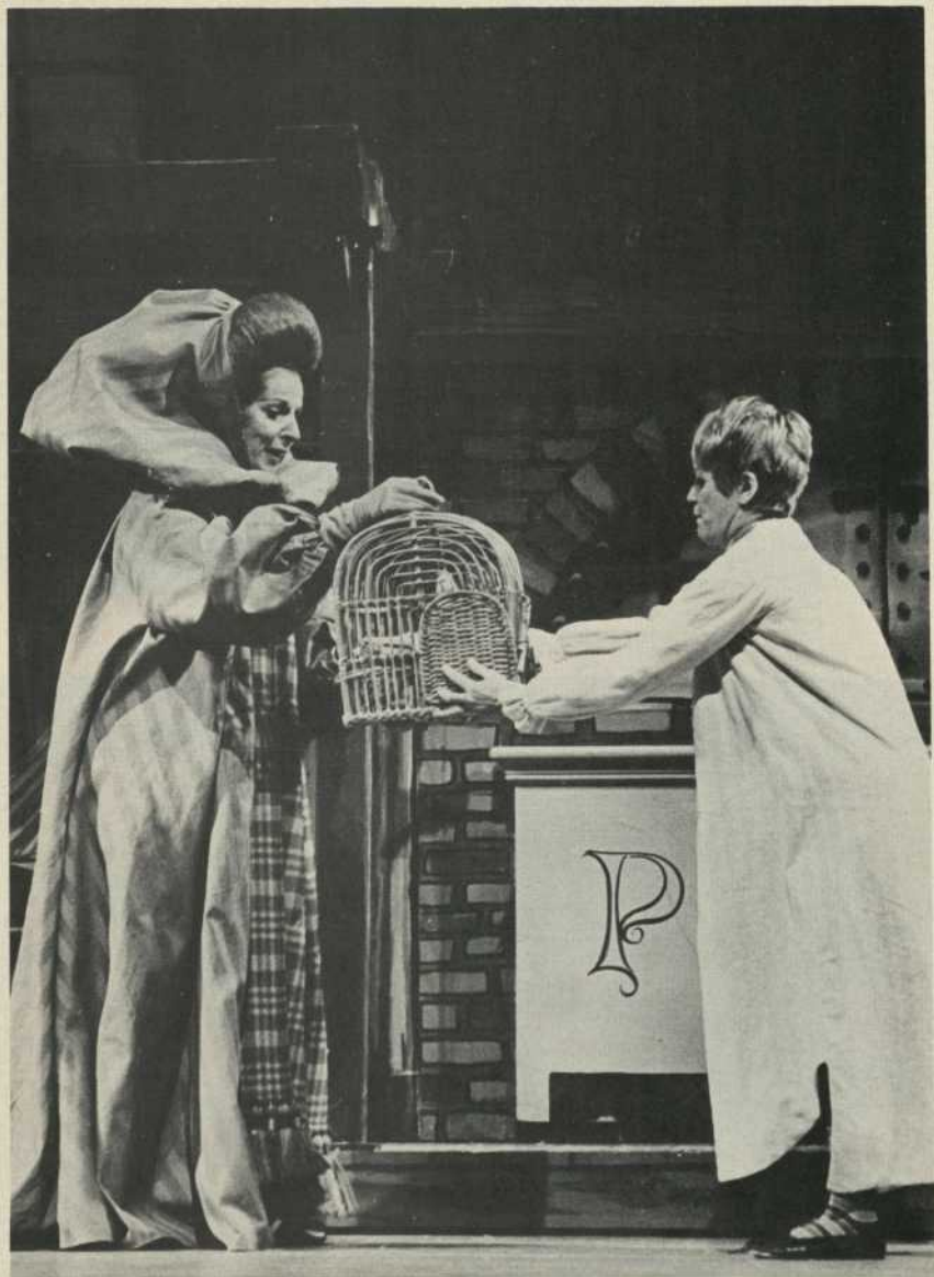
La voisine Berlingot — Tytyl