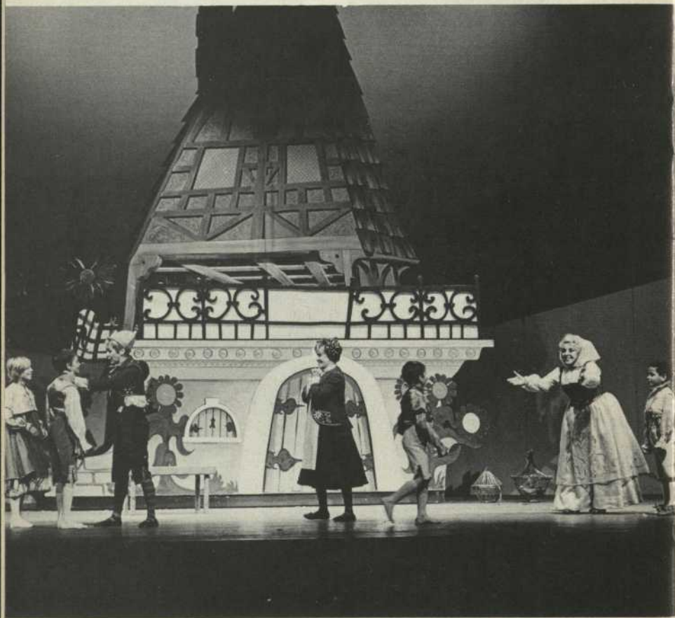
La Maison du Souvenir