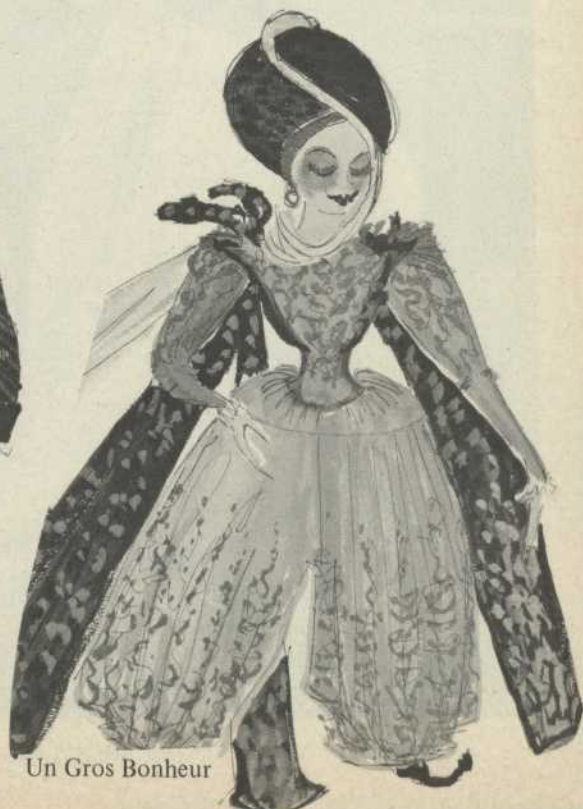
Un Gros Bonheur