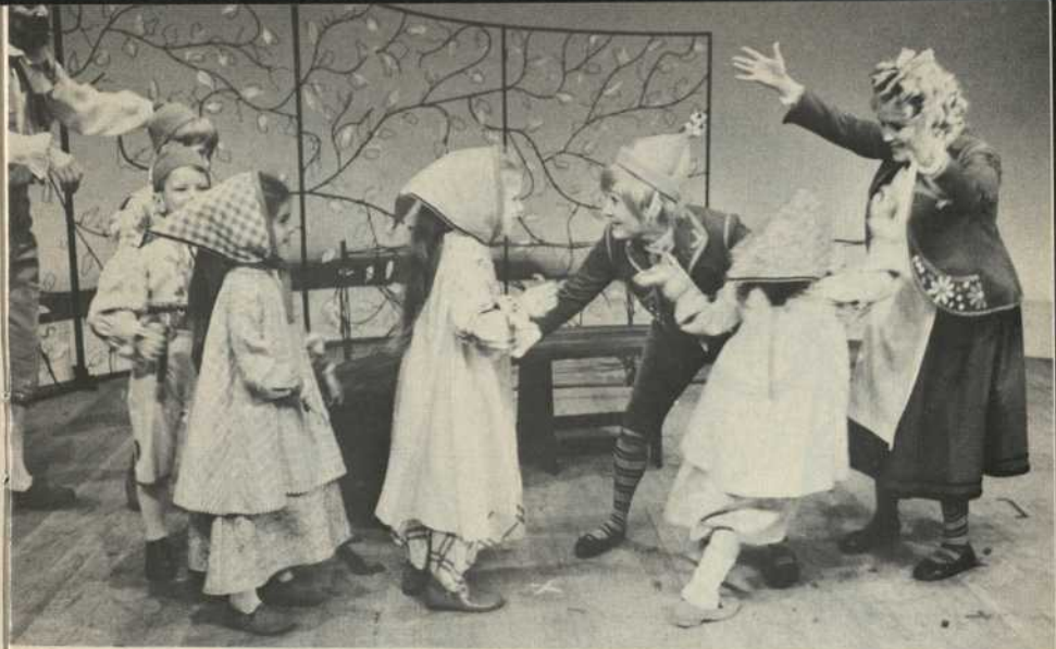
Les Gros Bonheurs, Tylytl et Mytyl