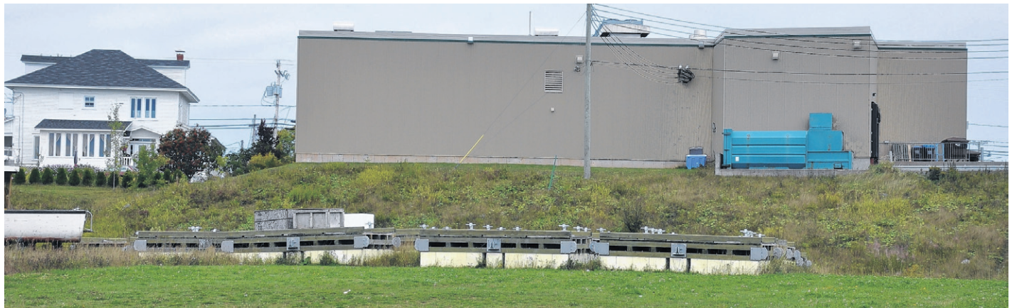
L'entreprise de Havre St-Pierre désire construire son complexe de 45X60 mètres sur le terrain situé derrière le supermarché IGA à Grande-Rivière. Le terrain appartient au ministère qui est actuellement en processus de cession avec la Ville de Grande-Rivière.

En ce qui concerne le permis pour importer des œufs, la démarche semble vouée à l'échec, a appris Pêche Impact. Pour amorcer son élevage de saumon, CanAquaculture a dans ses cartons, le projet d'importer des œufs de saumon d'Europe