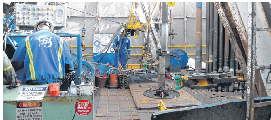
Pour des forages en milieu hydrique, les entreprises pourraient techniquement creuser aussi près qu'à 60 mètres d'un parc national. Ou à 40 mètres du Saint-Laurent.

L'entrée en vigueur des règlements doit se faire d'ici la fin de l'année 2017. Ils ont été prépubliés dans la Gazette officielle du Québec hier et une période de commentaires de 45 jours s'en suit. Le seul hic, c'est que toutes les municipalités du Québec seront dissoutes au début du mois d'octobre à cause des élections qui auront lieu le 5 novembre. La situation ne laisse que peu de temps aux conseils municipaux pour étayer leur point de vue et faire part de leurs commentaires officiels.