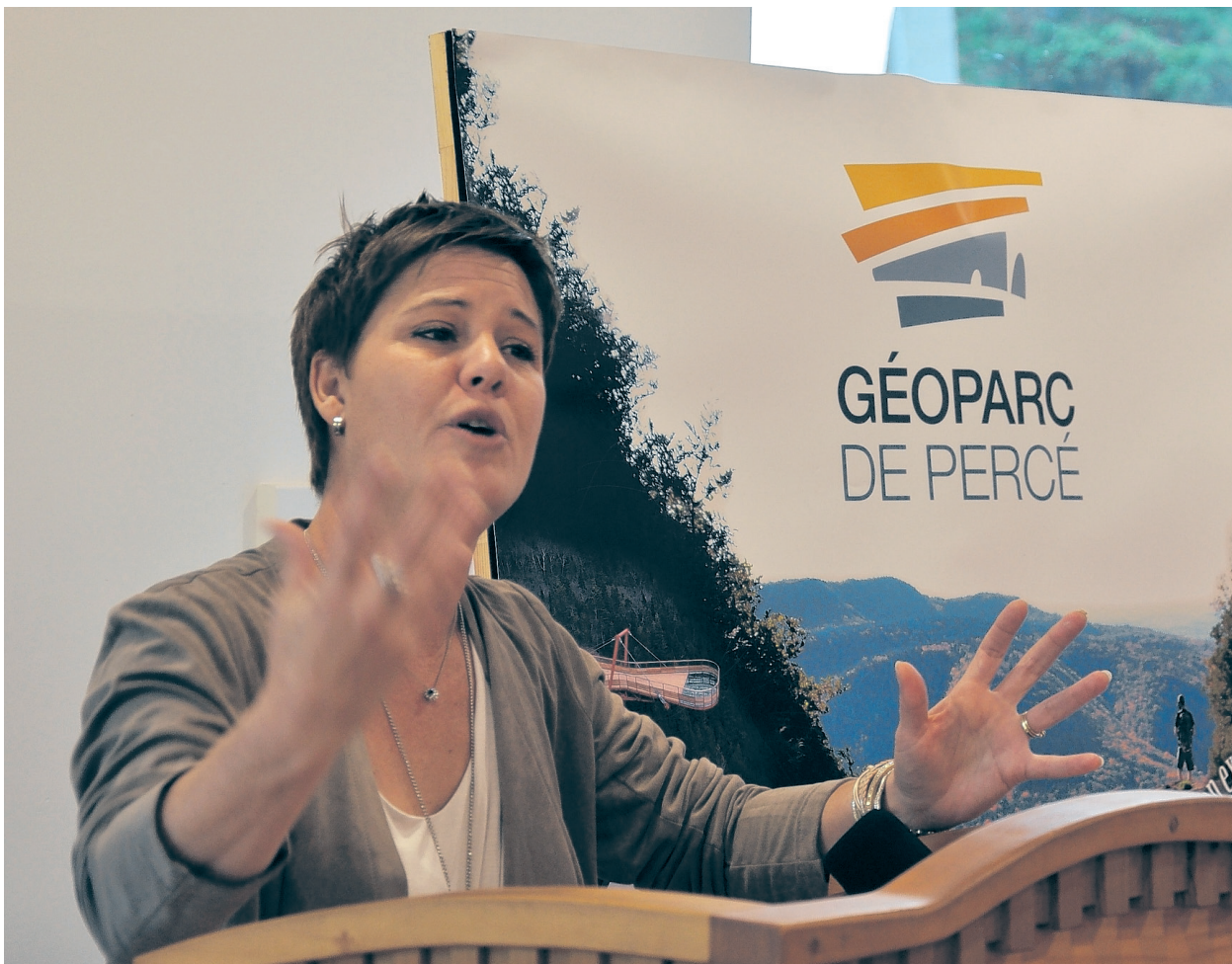
Très heureuse, la présidente du Géoparc a indiqué toute l'importance du Géoparc de Percé de faire partie de l'UNESCO.

C'est en avril 2018 que la décision du comité devrait être rendue. Le Géoparc de Percé pourrait alors devenir le troisième géoparc canadien à faire partie de l'organisme mondial après celui de Stonehammer, situé au sud du Nouveau-Brunswick, et Tumbler Ridge, en Colombie-Britannique.