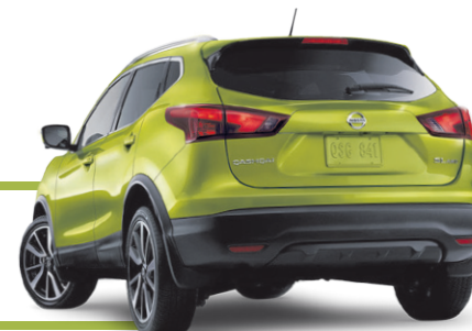
Qashqai SL Platine illustré*

CONSULTEZ CHOISISSEZNISSAN.CA POUR PLUS DE DÉTAILS. | L'ASSOCIATION DES CONCESSIONNAIRES NISSAN DU QUÉBEC