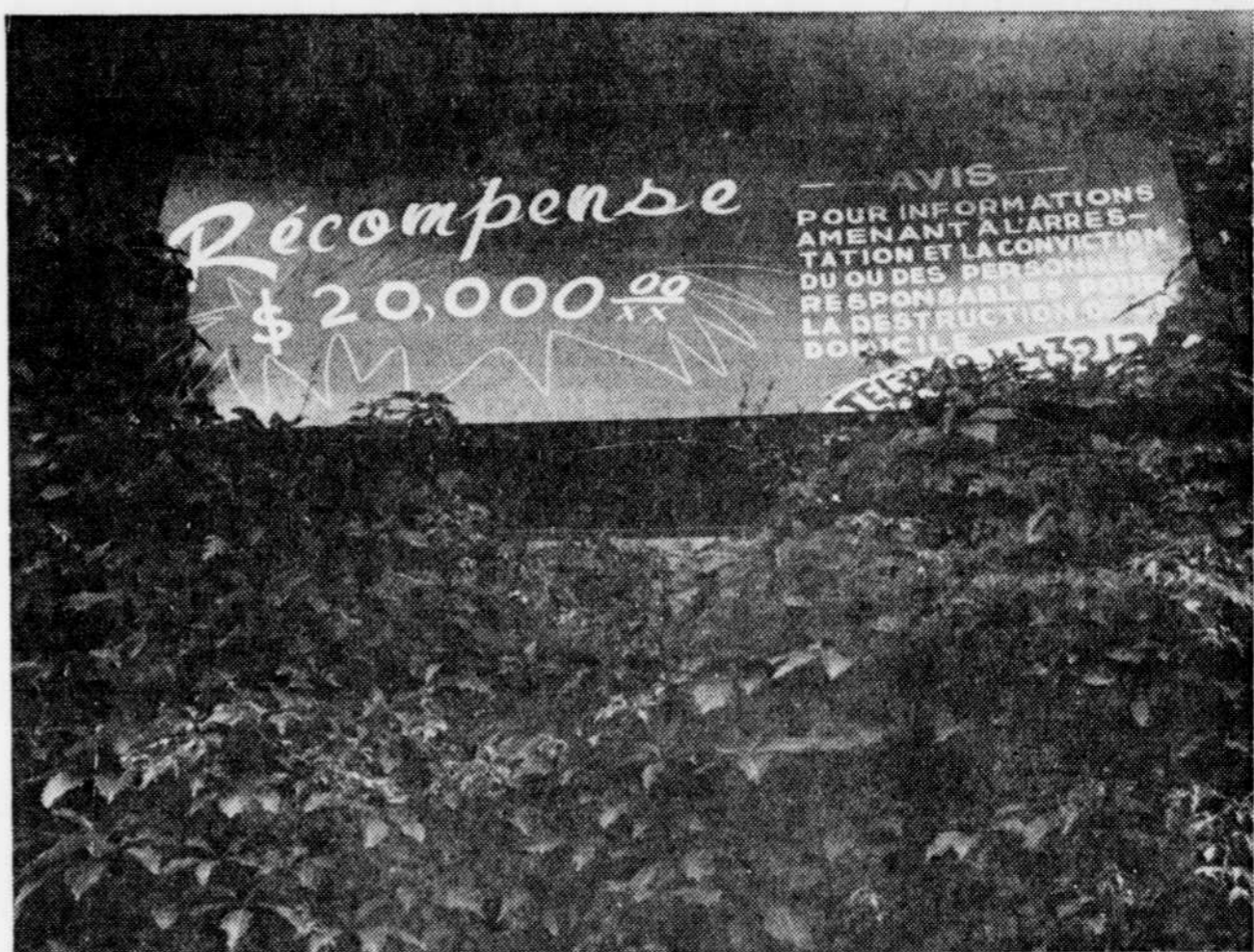
Une initiative qui n'a rien donné.

Pendant l'arrêt de travail, le 13 juin, un incendie allumé par une main criminelle occasionna des dégâts évalués à $50,000 dans les bureaux de la Laiterie Pépète d'or. L'affaire est encore devant les tribunaux.