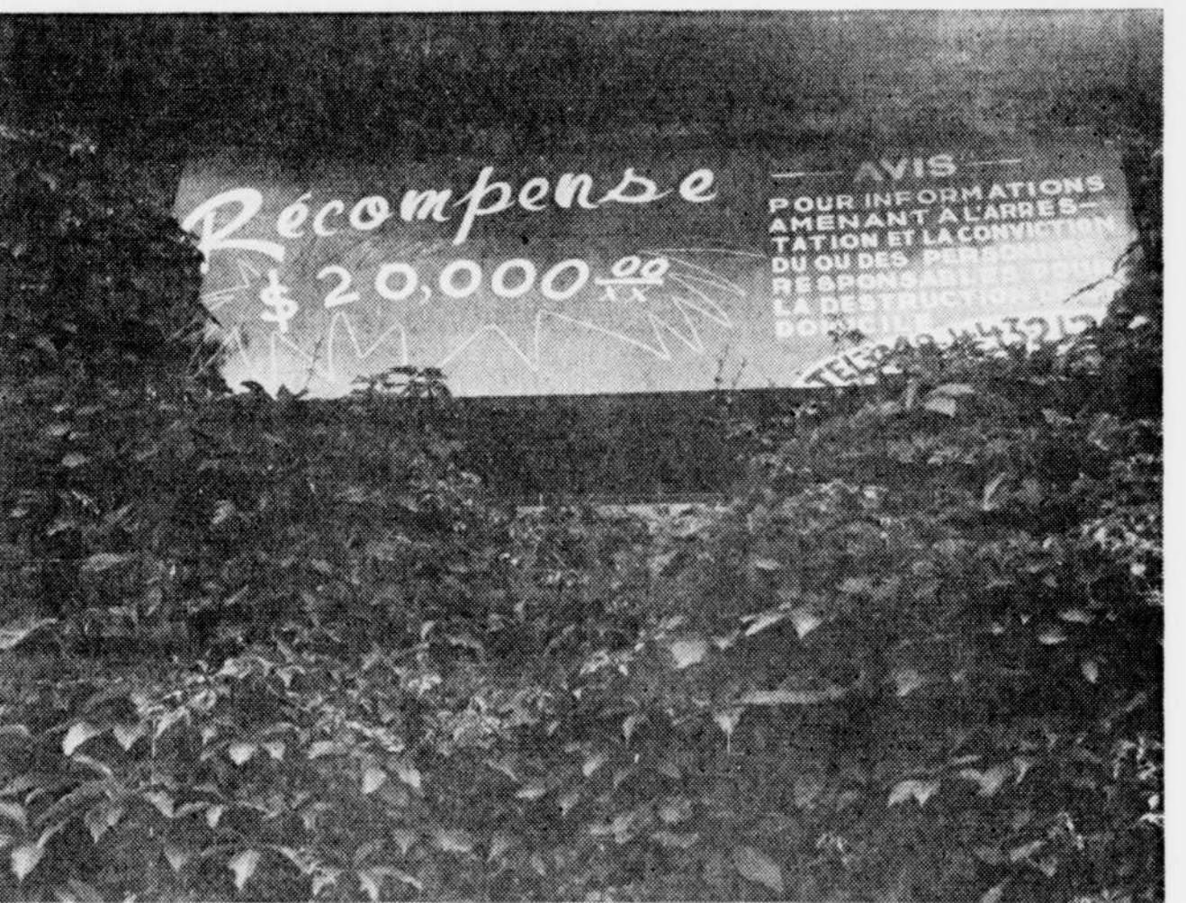
Une initiative qui n'a rien donné.

Pendant l'arrêt de travail, le 13 juin, un incendie allumé par une main criminelle occasionna des dégâts évalués à $50,000 dans les bureaux de la Laiterie Pépète d'or. L'affaire est encore devant les tribunaux.