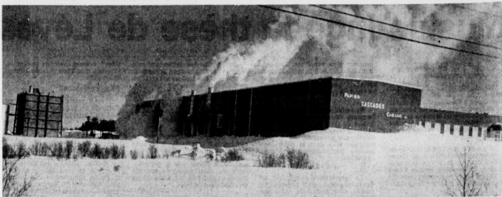
Papier Cascades (Cabano) Inc. reçoit $3.7 millions de Rexfor et de la SDI

PLESSISVILLE — Cédant sous les pressions de l'Association des gens d'affaires de Plessisville, le conseil municipal de cette ville prolonge jusqu'au 1er juin le stationnement gratuit les jeudis et vendredis soir. L'essai effectué jusqu'à présent s'est avéré concluant. La "mise en veilleuse" des parcomètres durant ces soirées a activé l'achalandage dans les établissements commerciaux.