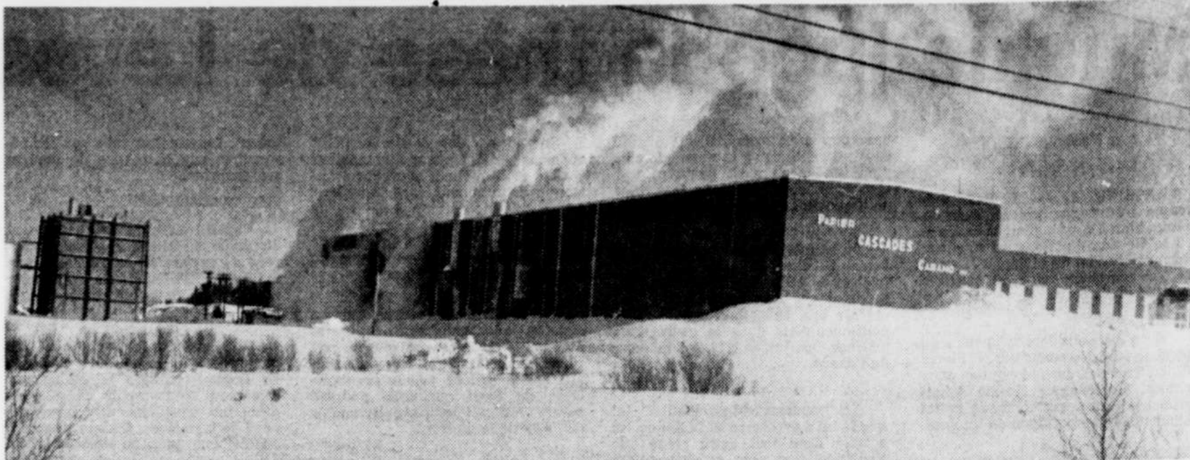
Papier Cascades (Cabano) Inc. reçoit $3.7 millions de Rexfor et de la SDI

PLESSISVILLE — Cédant sous les pressions de l'Association des gens d'affaires de Plessisville, le conseil municipal de cette ville prolonge jusqu'au 1er juin le stationnement gratuit les jeudis et vendredis soir. L'essai effectué jusqu'à présent s'est avéré concluant. La "mise en veilleuse" des parcmètres durant ces soirées a activé l'achalandage dans les établissements commerciaux.