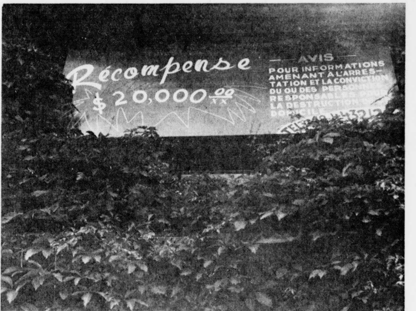
Une initiative qui n'a rien donné.

Pendant l'arrêt de travail, le 13 juin, un incendie allumé par une main criminelle occasionna des dégâts évalués à $50,000 dans les bureaux de la Laiterie Pépète d'or. L'affaire est encore devant les tribunaux.