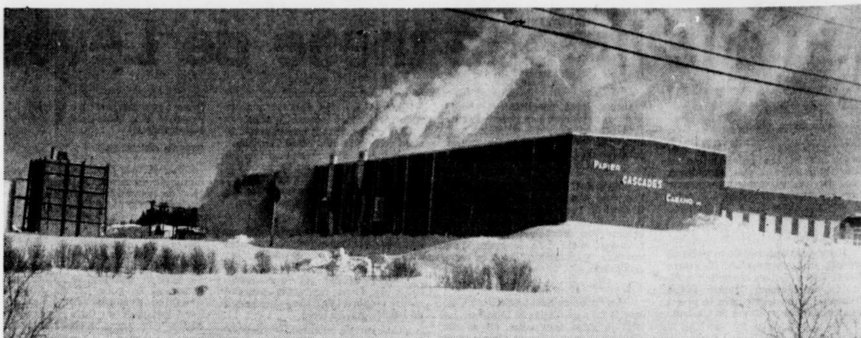
Papier Cascades (Cabano) Inc. reçoit $3.7 millions de Rexfor et de la SDI

PLESSISVILLE — Cédant sous les pressions de l'Association des gens d'affaires de Plessisville, le conseil municipal de cette ville prolonge jusqu'au 1er juin le stationnement gratuit les jeudis et vendredis soir. L'essai effectué jusqu'à présent s'est avéré concluant. La "mise en veilleuse" des parcmètres durant ces soirées a activé l'achalandage dans les établissements commerciaux.