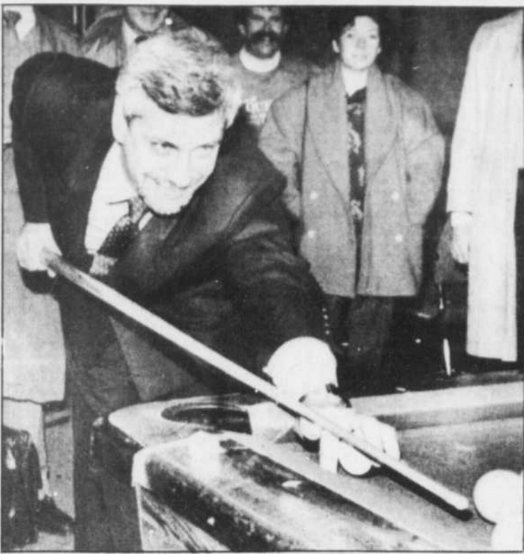
Pendant sa tournée électorale, le premier ministre Pierre Marc Johnson s'est permis de jouer au billard quelques minutes, hier, au Club des employés civils, à Québec.