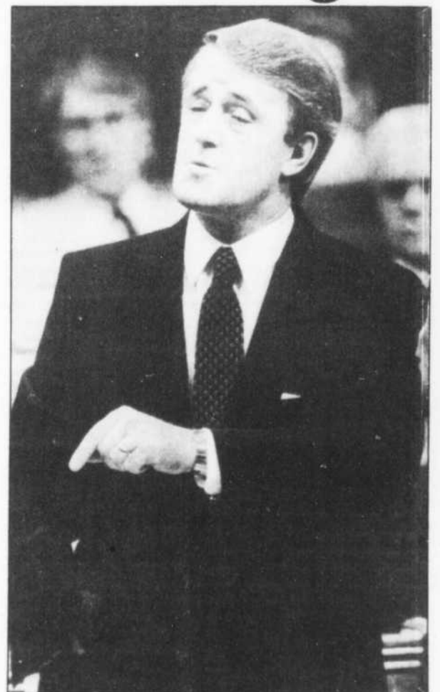
Le premier ministre Mulroney

M. Mulroney a profité de l'occasion pour rappeler que son gouvernement n'avait pas tellement besoin