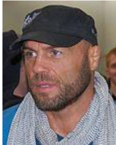
Randy Couture Voir le Héraut (été 2016)

Le titre de l'article qui traite de la descendance de Guillaume Couture est d'ailleurs Viking Famous Norman: Guillaume Couture . Randy "The Natural" Couture among other Couture's are descendants of Guillaume Couture a Hero of New France. Traduction: Randy "The Natural" Couture, parmi d'autres Couture, descend de Guillaume Couture, héros de la Nouvelle-France.