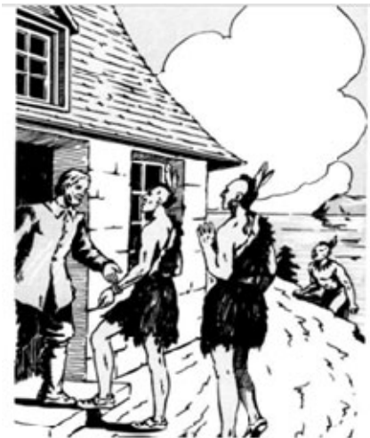
"Guillaume Couture accueille trois Inuites qui ont hérité leur coutume au lieu de sa maison" (suite d'octobre), chap. 1 p.28 Guillaume Couture, premier colon de la Pointe-Lévy (Lauzon) p79.