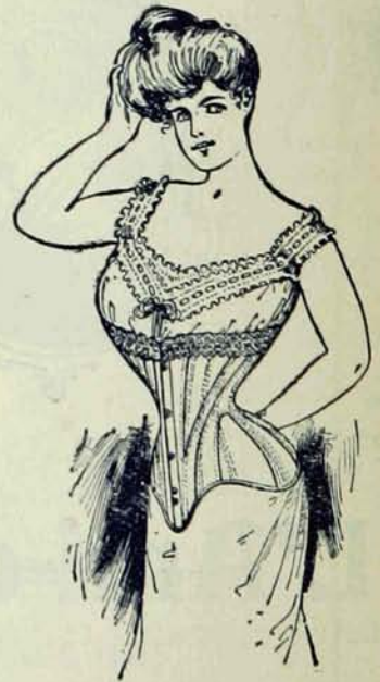
MODELES LES PLUS NOUVEAUX.

Les Dames qui insistent pour avoir les Crompton ne le regrettent jamais.