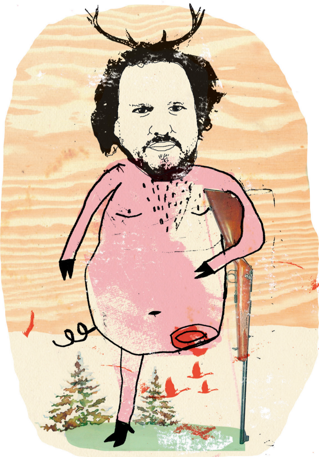
ILLUSTRATION FRANCIS LÉVEILLÉE, LA PRESSE