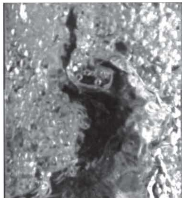
Le comportement complexe de la phase gazeuse est la bête noire des numériciens.