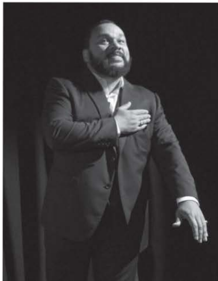
Quenelle glissée par Dieudonné, protestant contre le «système».

Dans un contexte où certains pays sont mis à feu et à sang pour des sketches ridiculisant des figures religieuses (référence aux conflits entourant les caricatures du prophète Mohammed), il est judicieux de choisir les sujets à tourner en dérision. Malgré des intentions de dénonciations de racisme et de doubles mesures sur les groupes « disponibles » pour l'humour, l'opinion public continue de se diviser entre ceux qui comprennent que certaines paroles dites dans un contexte humoristiques ont moins de poids, et ceux qui sautent au rideaux à un rien et qui cherchent des microbes là où il n'y en a pas. Pour les indécis, je suggère de regarder ses spectacles, histoire de vous faire votre propre opinion.