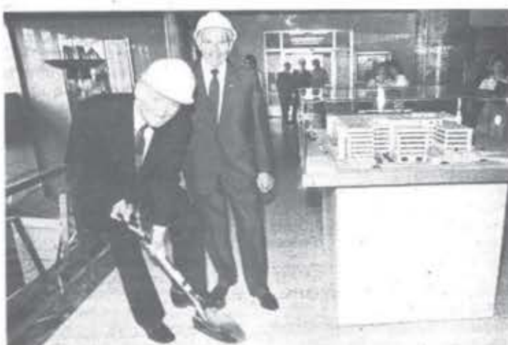
Lors du conflit de travail des employés de soutien, l'École fit appel aux cadres pour les remplacer. Sur la photo ci-dessus, on voit M. Claude Ryan, ministre de l'éducation, qui s'est gentiment déplacé de Québec pour balayer le hall d'entrée. Par respect pour le brave homme, personne de l'École n'a voulu lui faire remarquer qu'il n'utilisait pas le bon instrument...