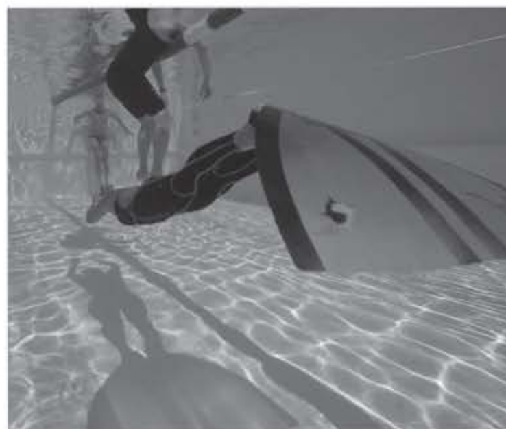
La monopalme est souvent utilisée pour l'apnée dynamique à haut niveau car elle a un très bon rendement.

On comprend que moyennant une pratique sécuritaire, la recherche de la performance passe par une pratique régulière et une bonne relaxation. La pratique du yoga en parallèle est un bon moyen de mieux être attentif aux réponses de son corps et d'éviter une rupture de l'apnée pour des raisons mentales. Les séances permettent de toucher du doigt la zone de lutte ou d'inconfort que l'on cherche à repousser progressivement. Que ce soit pour la chasse sous-marine, la recherche de relaxation, le simple plaisir de retenir sa respiration ou