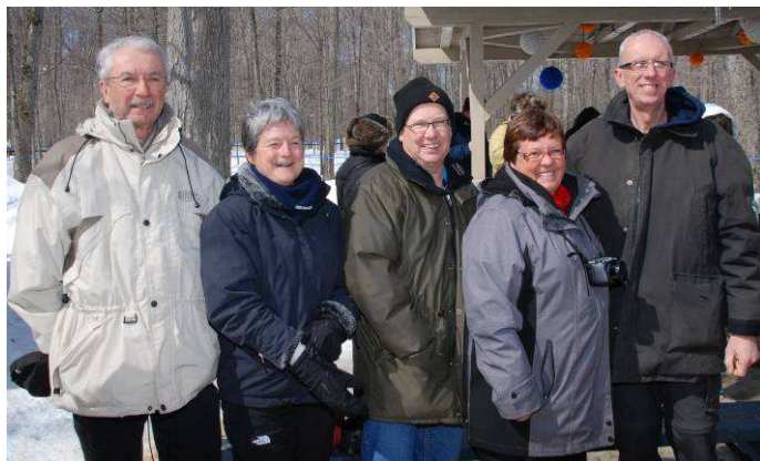
Les membres du CA fiers de la réussite de cette activité