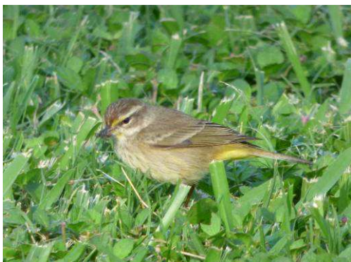
Paruline à couronne rousse

Objectif secret atteint! Photos à l'appui ;-)