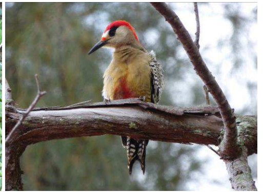
Pic à sourcils noirs