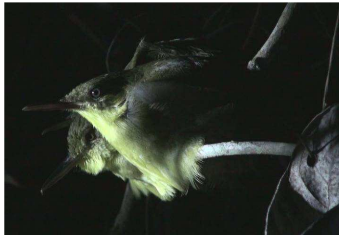
3 Tétrakas à long bec au dortoir, la nuit tombée