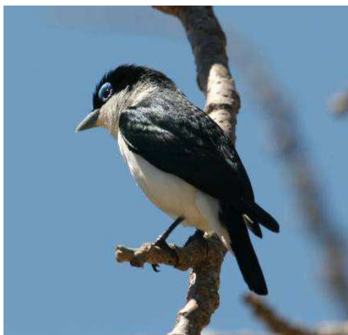
Vangas de Chabert (à remarquer l'oeil de l'oiseau)