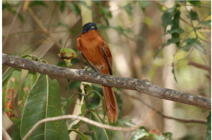
Gobemouches: Mâle à gauche et femelle ci-dessus

L'autre oiseau commun mais spécial dont nous avons rencontré les 2 autres espèces, une en Afrique et l'autre en Chine est l'étonnante Huppe malgache (Hoopoe); elle mange surtout par terre ce qui la rend plus facile à photographier.