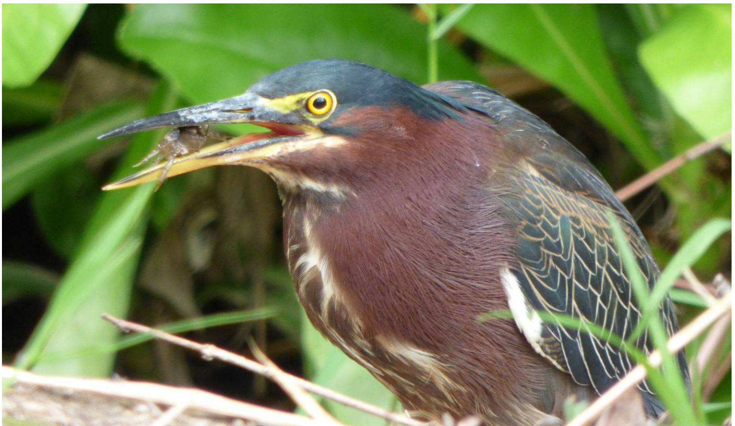
Héron vert avec sa proie