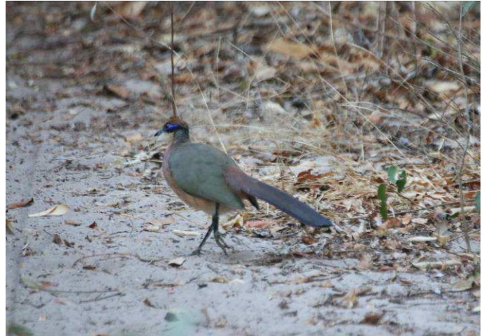
Coua à tête rouge

Les Éroesses, la petite, la grande et la verte, sont de petits passereaux jaunâtres semblables au viréo, que nous avons toutes cochées. La petite qu'on nomme "Common Jerry" en anglais, moi je la nommais "Come on Jerry!" car elle surgissait toujours sur notre parcours, et on n'avait presque plus le droit de la regarder, tellement j'avais de la difficulté à la reconnaître.