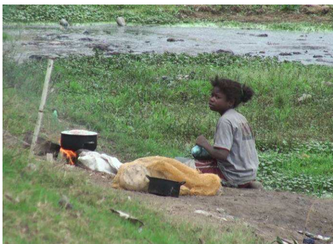
Petite fille au lac Anosy

Commençons par l'oiseau le plus spécial rencontré en premier à Tana (3) sur le lac Anosy, près de notre hôtel. L'Aigrette ardoisée qu'il ne fallait pas confondre avec l'Aigrette dimorphique qui se trouve partout sur l'île autant de forme blanche (4) noire et grisâtre.