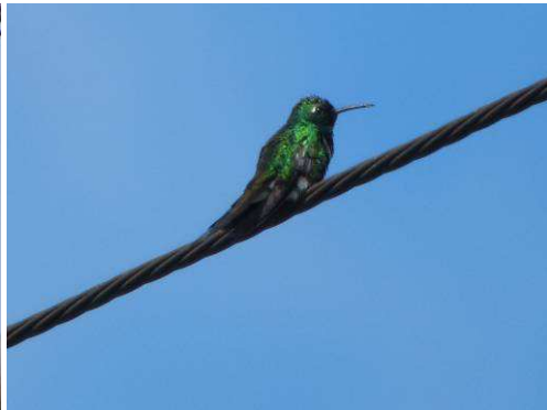
Émeraude de Ricord