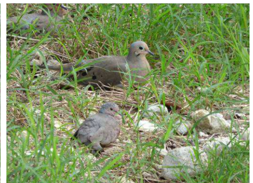
Tourterelle triste et Colombe à queue noire