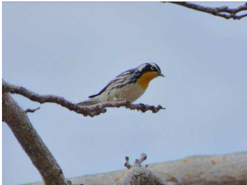
Paruline à gorge jaune