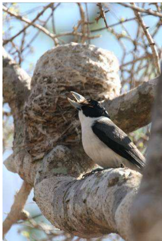
Vanga de Lafresnaye

Les Vangas quant à eux sont des oiseaux spéciaux, dont les plus gros font de 23 à 32 cm et sont noir et blanc et les becs sont tous construits de façon différente (longs et courbés, ouverts, et souvent crochus tel un oiseau de proie probablement en fonction de leur nourriture. Le plus intéressant serait l'Eurycère de Prévost ( Helmut Vanga ) avec son bec massif bleu tel un Calao. Il aurait fallu aller dans la forêt pluvieuse du Nord-Est pour le retrouver et ce, sans en être certains. Il y a les beaux Vangas bleus et blanc dont le Vanga de Chabert avec un œil qui ressemble au bouton servant d'œil à l'ourson en peluche.