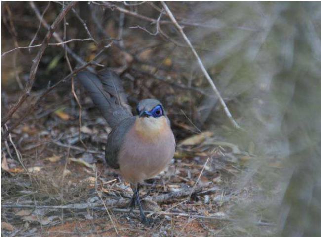
Coua à tête olive

Parlons des autres oiseaux endémiques qu'on retrouve à Madagascar, à condition de faire plusieurs Parc nationaux dans différentes régions (forêts pluvieuses et désertiques etc.). Le Coua de la famille des Cuculideas comprend 9 espèces et une sous-espèce d'oiseaux endémiques de Madagascar. À part les 3 qui ressemblent à des Coulious (Mousebirds) qu'on rencontre en Afrique, les 7 autres ne ressemblaient à aucun autre vu auparavant. Genre de grosse poule colorée à longue queue et avec la particularité de tous les Couas et Coulious, soit le tour de l'œil coloré. Nous en avons trouvé 9 espèces sur 10.