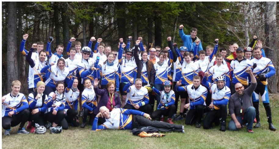
Les participants de la Commission scolaire des Phares à leur arrivée

C'est avec enthousiasme que les organisateurs du Défi vélo de la route du Grand Fleuve entrevoient une deuxième édition l'an prochain!