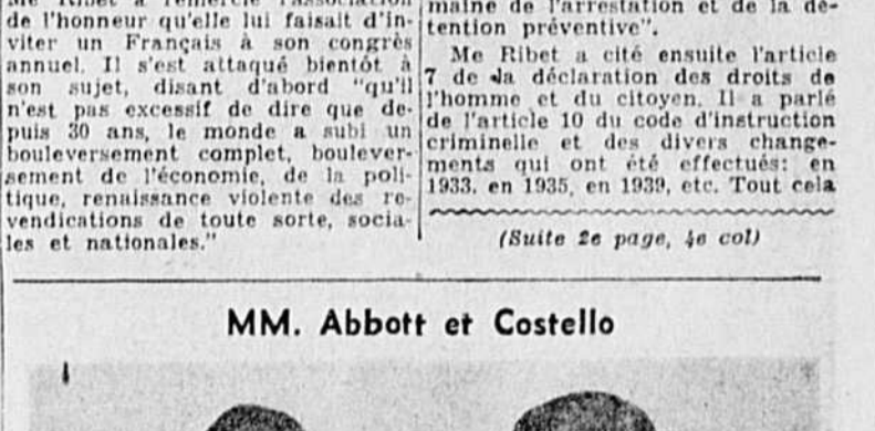
MM. Abbott et Costello

Parmi les grands personnages qui participent présentement aux assises de l'Association du Barreau canadien, à Montréal, se trouvent le populaire ministre des Finances le A. H. D. C. Abbott, et le premier ministre d'Irlande, l'hon. John Costello. Notre photographie a surpris les deux hommes politiques au moment où ils causaient entre deux séances du congrès. MM. Abbott et Costello jouissent d'une grande estime chez les juristes canadiens.