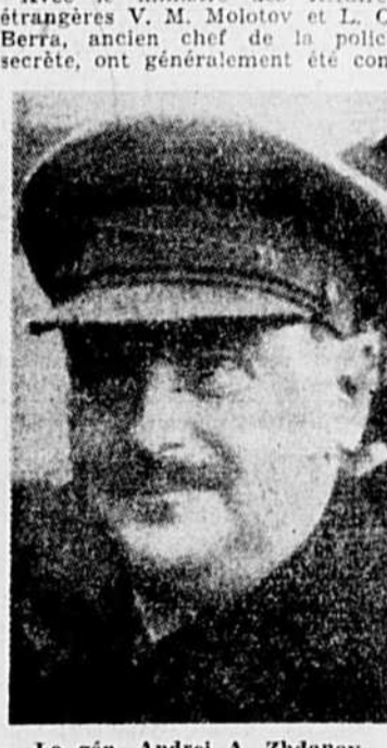
Le gén. Andrei A. Zhdanov

LONDRES, 31 (A.P.) — Moscou a annoncé hier soir la mort d'André A. Zhdanov, un des principaux cadres (très discrètement) au poste que le maréchal Staline voudra un jour laisser. Zhdanov est mort hier après-midi à la suite d'une grave maladie. Zhdanov, 52 ans, était le secrétaire du comité central du parti communiste. Il a été une des principales figures de l'attaque sensationnelle d'il y a deux mois contre le maréchal Tito de Yougoslavie.