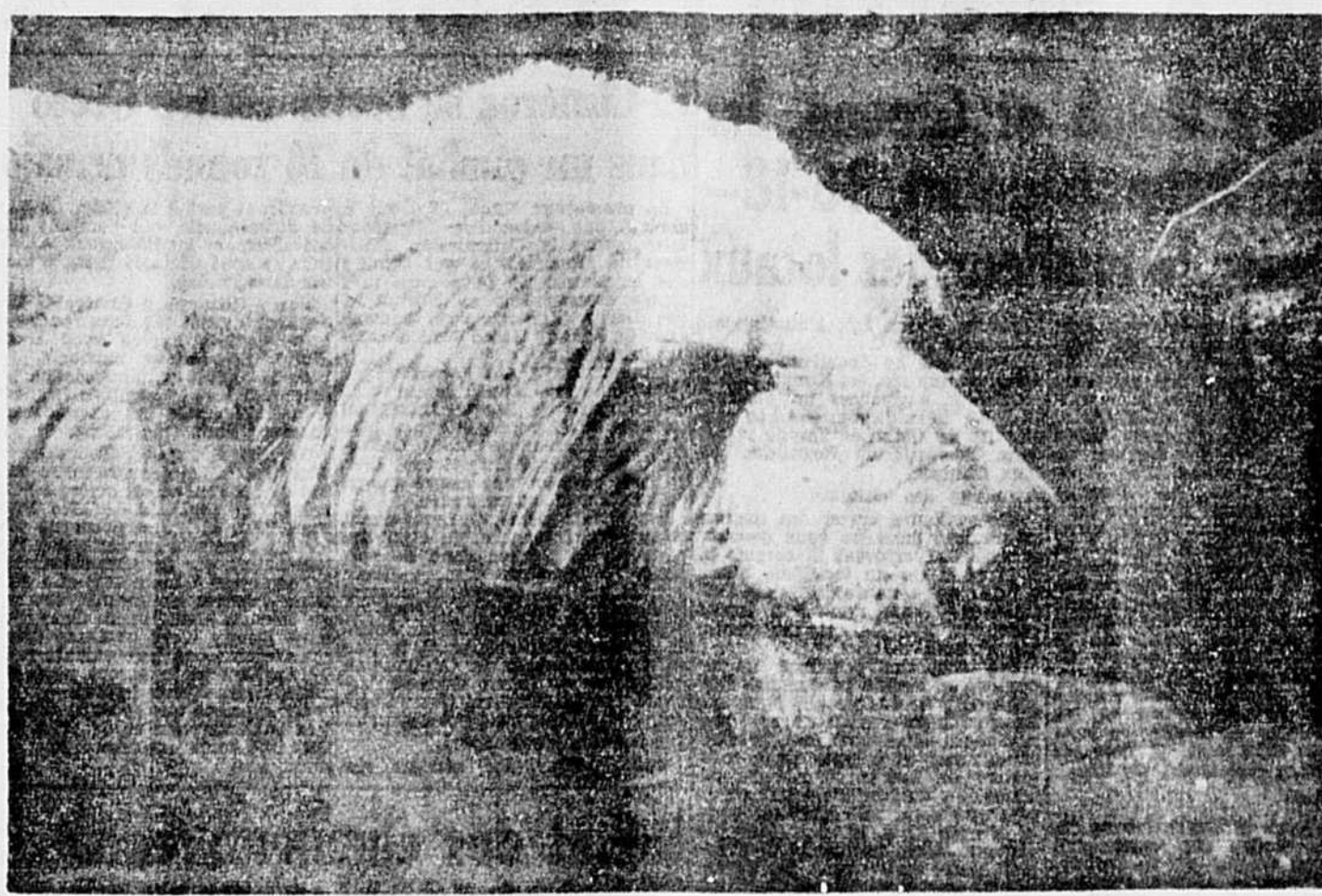
Vous vous le donnez en mille. A qui ou un peu... Est-ce un mouton qui fuit les à quel appartient cette étrange tête. Cherchez les mouches? Un chien qui prend son bain?... C'est un ours polaire, qui prend ses ébats dans son étang, au "zoo" de New-York.

Le poste WCBS de New-York diffusera en anglais le programme "Mémo from Lake Success" chaque dimanche matin, de 9 h. 45 à 10 h.