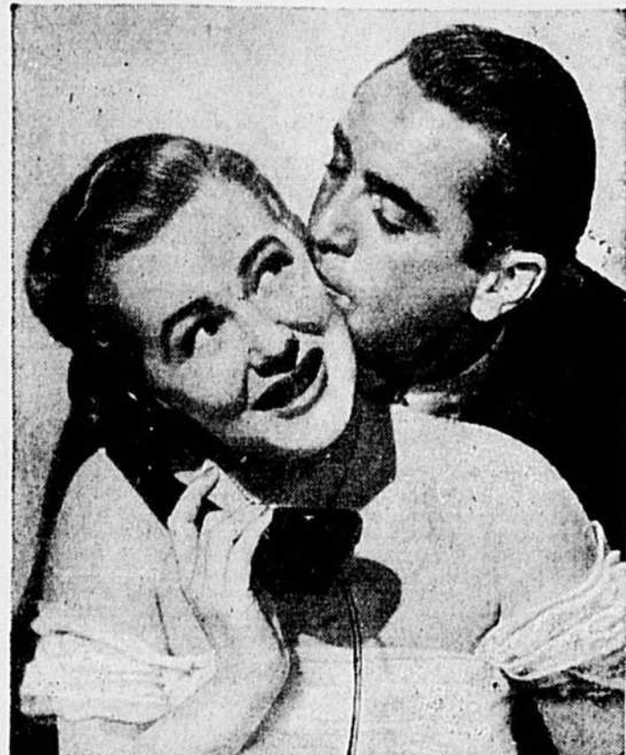
Une scène du film "Dream Girl", film interprété par Betty Hutton et Macdonald Carey, qui sera présenté au cinéma Impérial, en programme double avec "Blonde Ice".