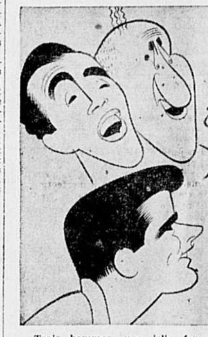
Trois hommes, une jolie femme... Peter Lawford, Jimmy Durante, Ricardo Montalban et Esther Williams, les vedettes du film "On An Island With You", actuellement à l'affiche du cinéma Loew's.

Lifar accompagnera le Ballet de l'Opéra Serge Lifar, qui vint danser à Montréal un soir de novembre 1933, reviendra dans la métropole canadienne à titre de chorégraphe. Il l'accompagne en effet la troupe du Ballet de l'Opéra de Paris actuellement en mer à bord de l'"Empress of France". On sait qu'Yvette Chauviré et les autres vedettes de la troupe donneront au His Majesty's deux des plus récents ballets de Lifar, "Le Chevalier et la Damaïsselle" et "Les Mirages", en plus de "Le Mariage de Figaro" et "Le Divertissement".