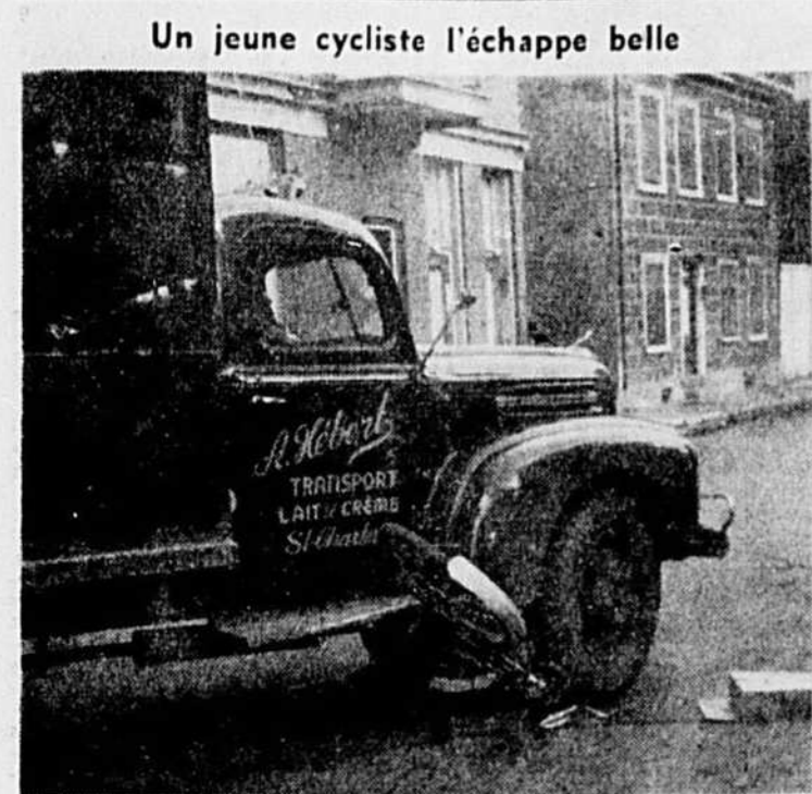
Un jeune cycliste l'échappe belle

Gilles Laflamme, 13 ans, dont les parents habitent 1440, rue Cartier, messager à l'emploi d'une épicerie de cette ville, pilotait sa bicyclette vers le nord, rue Champlain vers 10 h. 15 hier matin, quand il entra en collision avec un camion de transport, conduit par M. Paul-Emile Charron, 22 ans, de Saint-Charles-de-la-Rivière Chamby (comté de Saint-Hyacinthe), voyageant vers le sud sur la même artère, et tournant alors vers l'est, rue Ste-Rose. Comme on le constate sur cette photo, la bécane fut écrasée sous les roues du lourd véhicule. Le jeune cycliste lui-même fut littéralement lancé sur le trottoir, après avoir roulé entièrement sous le véhicule. Malgré tout, il s'échappa avec une jambe fracturée. Ce sont les agents Roméo Normandin et Gaston Drolet, de Radio-Police, qui transportèrent le jeune blessé à Ste-Justine où il fut admis par le Dr Saint-Pierre, interne. (Photo "Le Canada", par Sasseville.)