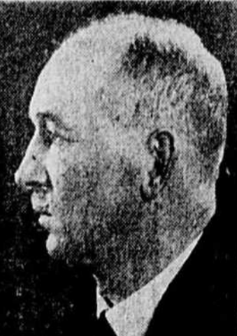
M. Edouard Bénès

PRAGUE, 31 (A.P.) — Un bulletin officiel donne la condition de l'ancien président Edouard Bénès comme étant très grave. Il est inconscient. Ses médecins disent qu'il est devenu inconscient vers 5 heures a.m. hier lors d'une grave rechute. Le co-fondateur de la république tchécoslovaque, âgé de 65 ans, qui a démissionné comme président en juin, a subi une attaque il y a un an et est malade depuis. Ses médecins ont révélé qu'il est dangereusement malade depuis une semaine. Il est à sa résidence d'été à 40 milles au sud de Prague. Quoique ses pouvoirs semblent fonctionner normalement, ses médecins croient que sa maladie sera la circulation du sang. Bénès a surmonté la révolution communiste tchécoslovaque de février dernier, mais dut s'incliner devant les exigences du parti communiste. Cette lutte l'a apparemment miné. Il s'est opposé à une simulation d'élection en mai et fut en juin à démissionner plutôt que de signer la constitution de la "démocratie du peuple". Bénès dit dans sa lettre de démission que son état de santé était une des raisons de sa démission. Il n'a laissé aucun doute, toutefois, que le principal facteur était la pression politique de son entourage. Il a été remplacé par le premier ministre communiste, Clement Goldward.