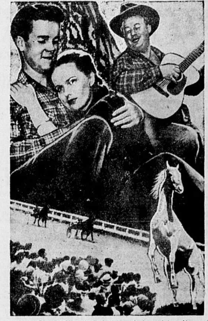
"Green Grass of Wyoming", dont les principaux interprètes sont Peggy Cummins, Charles Coburn et Robert Arthur, passera au cinéma Capitol à compter de vendredi prochain.