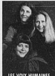
LES VOIX HUMAINES

HUME, COPERARIO, FERRABOSCO, SIMPSON, DOWLAND, JENKINS