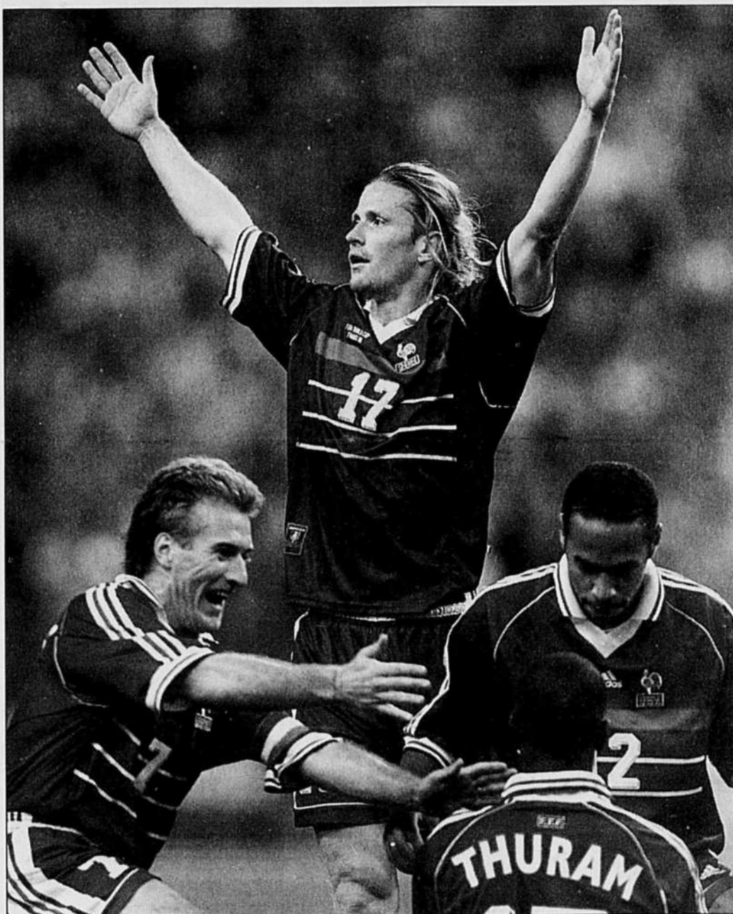
Le défenseur Lilian Thuram a largement contribué à la victoire de l'équipe française, contre la Croatie. La France accède pour la première fois à la finale de la Coupe du monde. L'exploit a été célébré sur le terrain et sur les Champs-Élysées par plus de 300 000 supporters en liesse criant «Thuram, président!». Nos informations, page B 5.