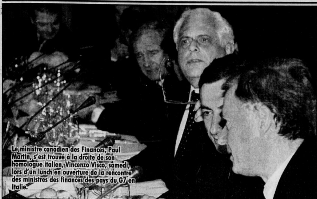
Le ministre canadien des Finances, Paul Martin, s'est trouvé à la droite de son homologue italien, Vincenzo Visco, samedi, lors d'un lunch en ouverture de la rencontre des ministres des finances des pays du G7 en Italie.

«La tendance vers le transfert d'employés à des firmes américaines qui paient 10$ de l'heure se poursuit. Ils viennent d'annoncer la formation de Certan, une coentreprise qui va assumer le traitement informatique de la facturation.»