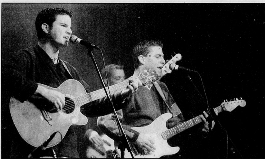
Le groupe Les Interdits a pris le premier rang de la catégorie auteur-compositeur au concours Découvertes 2001 de Magog.

Celui qui se compare à Francis Cabrel par le fait qu'il se caractérise par l'intensité de ses ballades, peut se débrouiller dans différents styles musicaux. La découverte de l'année 2001 indique que c'était la première fois qu'il ressentait une sensation aussi extraordinaire sur scène.