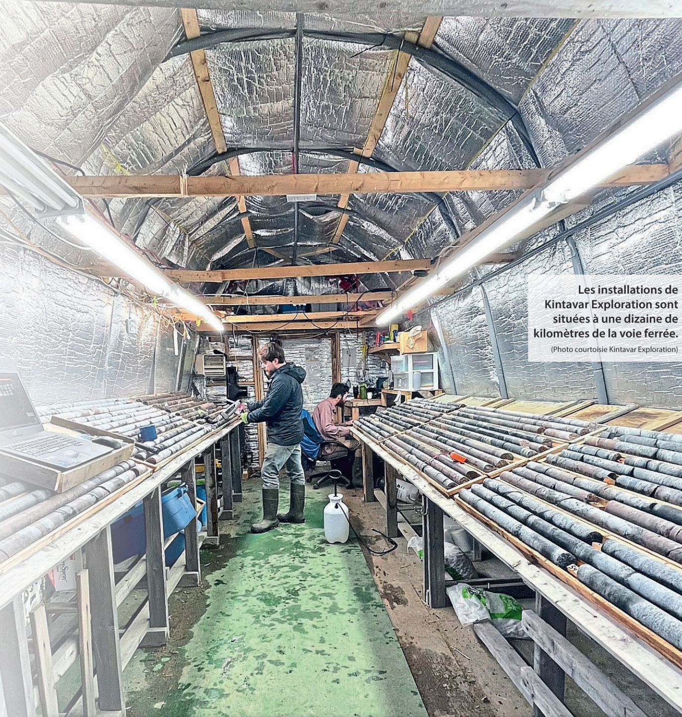
Les installations de Kintavar Exploration sont situées à une dizaine de kilomètres de la voie ferrée.