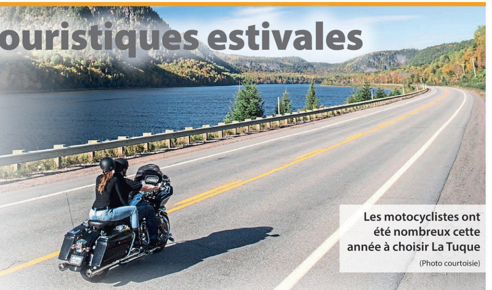
Les motocyclistes ont été nombreux cette année à choisir La Tuque

« Nous voulons poursuivre sur cette lancée l'an prochain en continuant de développer des projets qui permettront d'offrir d'autres activités et attraits à découvrir à La Tuque. Nous ciblons particulièrement les actions à mettre en place pour attirer plus de gens dans notre centre-ville. Nous travaillons également à offrir différents services à nos entreprises touristiques