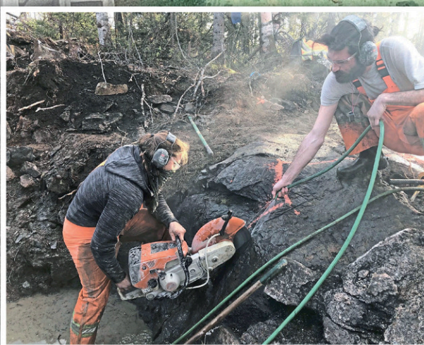
Une trentaine de travailleurs de Kintavar Exploration sont dans le secteur de Parent depuis le début de l'été pour y mener des travaux de forage.