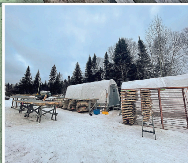
Les campements temporaires de l'entreprise sont installés depuis le courant de l'été 2021.