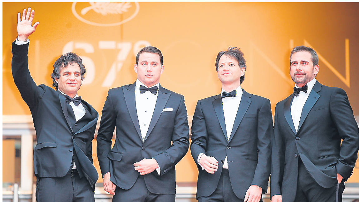
De gauche à droite : les acteurs Mark Ruffalo et Channing Tatum, le réalisateur Bennett Miller et le comédien Steve Carrell.