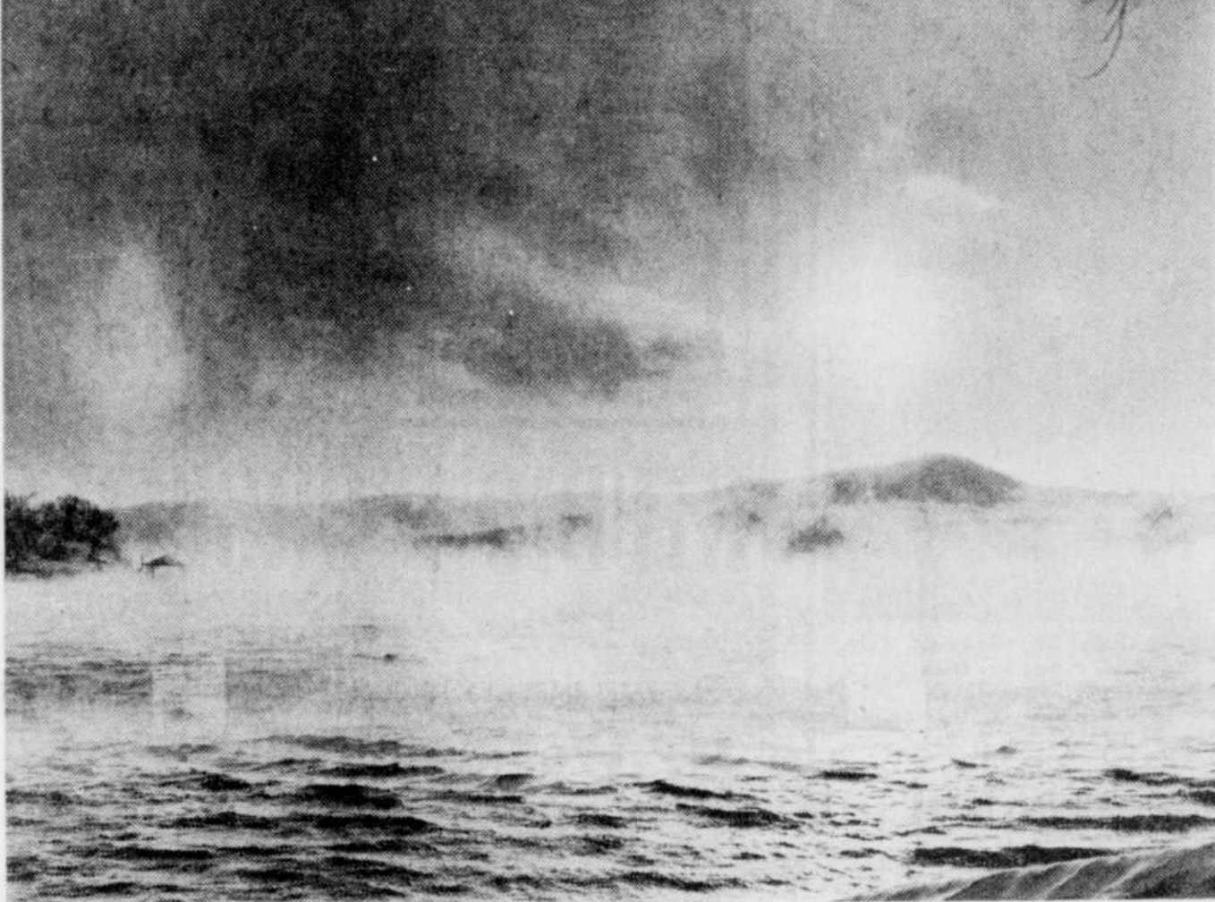
La poudrière et la brume dansaient sur les eaux déchainées, un soleil craintif faisait une légère trouée dans le ciel tout gris tandis que l'hiver établissait sa demeure pour de longs mois.