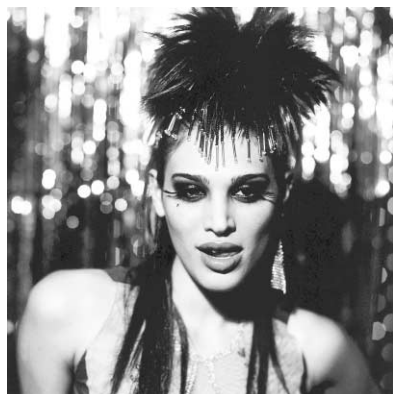
Munthe plus Simonsen

Et chez Sabine Poupinel, on propose carrément des gilets de poque bien cintrés, l'anti-Bardot, chic à mort.