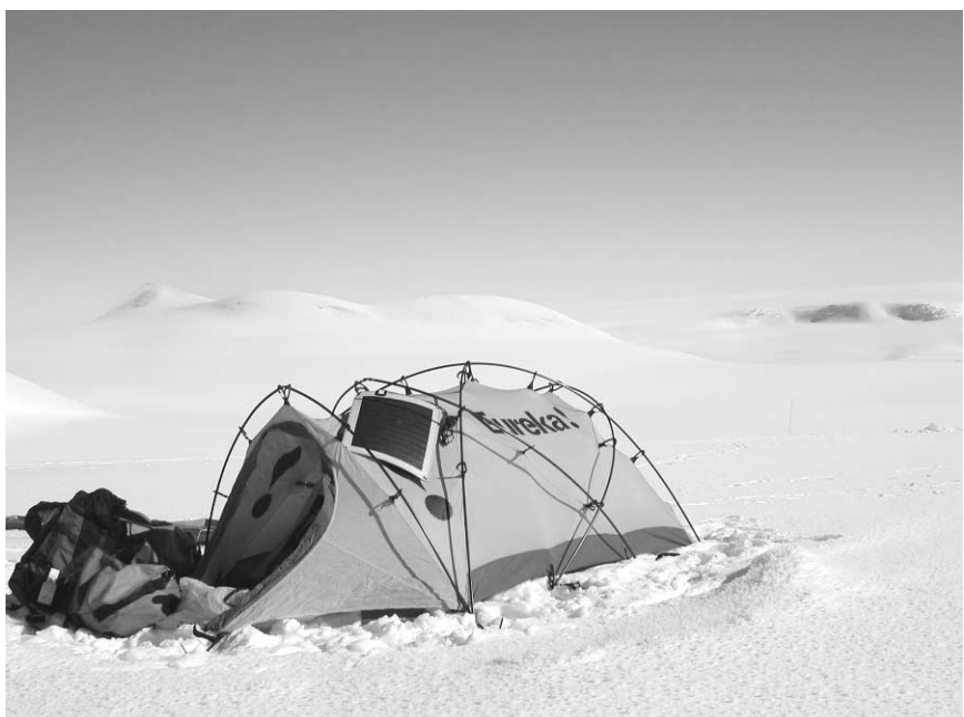
Dans l'Antarctique, les voisins se font rares.

Bruno Guglielminetti Collaboration spéciale actuel@guglielminetti.com