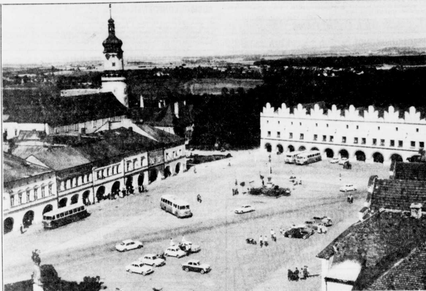
Avec ses maisons bourgeoises à arcades, la place publique Nove Mesto nad Metuji, en Tchécoslovaquie, fait partie des lieux qui ont reçu les touristes occidentaux en grand nombre.

Pour les responsables bulgares, il faut sans doute attribuer ce recul à une méfiance des touristes face à la situation dans un pays qui vient de connaître plusieurs bouleversements politiques : démissions en chaîne de plusieurs dirigeants, tension sociale et manifestations de rue.