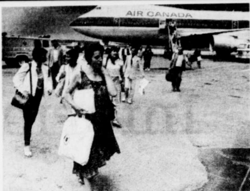
Les voyageurs en direction du Sud et de l'Europe n'auront pas à payer la TPS sur leurs frais de séjour.