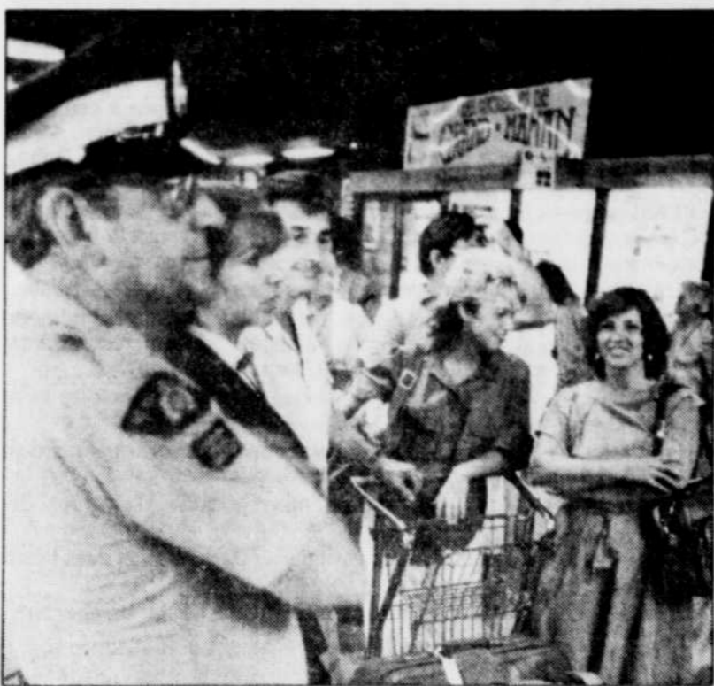
À l'étranger vous ne pourrez plus compter sur l'aide des officiers du gouvernement du Canada.

Le ministère des Relations extérieures du Canada, lui, n'a pas de catalogue où des informations du genre sont systématiquement colligées et mises à la disposition de ses citoyens. Tout au plus émet-il de temps en temps un avis public perdu dans le lot des actualités. « Renseignez-vous auprès du consulat américain », a suggéré au SOLEIL un représentant du Bureau des passeports, M. Guy Harvey, après qu'il eut logé des appels infructueux aux bureaux du ministère. « Les conditions qui prévalent pour les Américains sont pratiquement les mêmes que celles qui ont cours pour les Canadiens. »