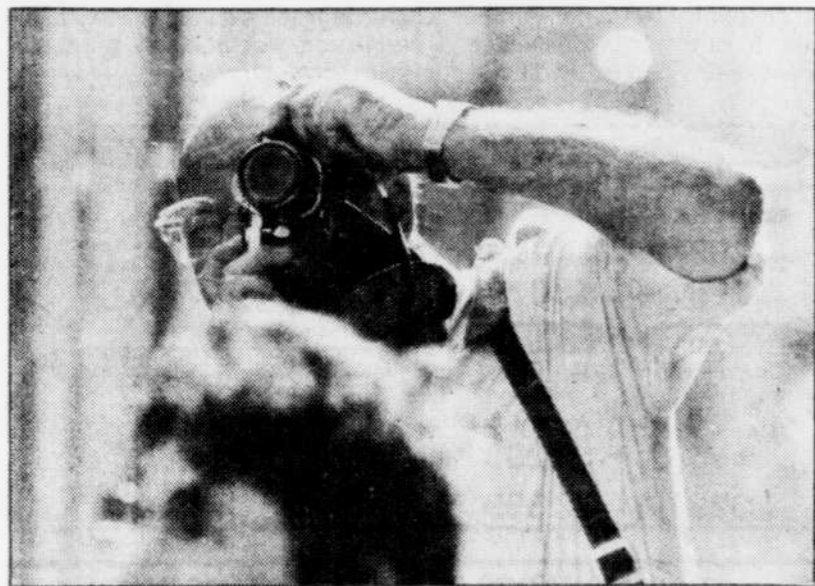
Il est interdit de faire de la photo sans autorisation policière dans certains pays d'Afrique.