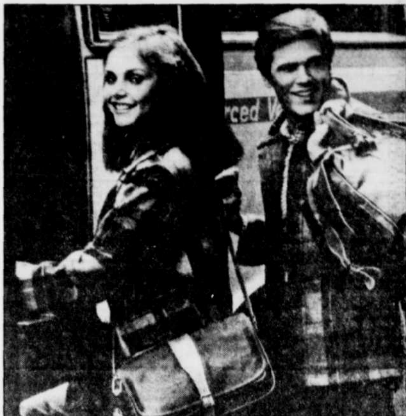
Les touristes se font rares en Israël et dans les pays du golfe Persique devant le spectre d'une guerre

Israël a accueilli l'an dernier 1,5 million d'étrangers qui ont apporté environ 1,7 milliard $ à l'économie, selon les chiffres du ministère du Tourisme.