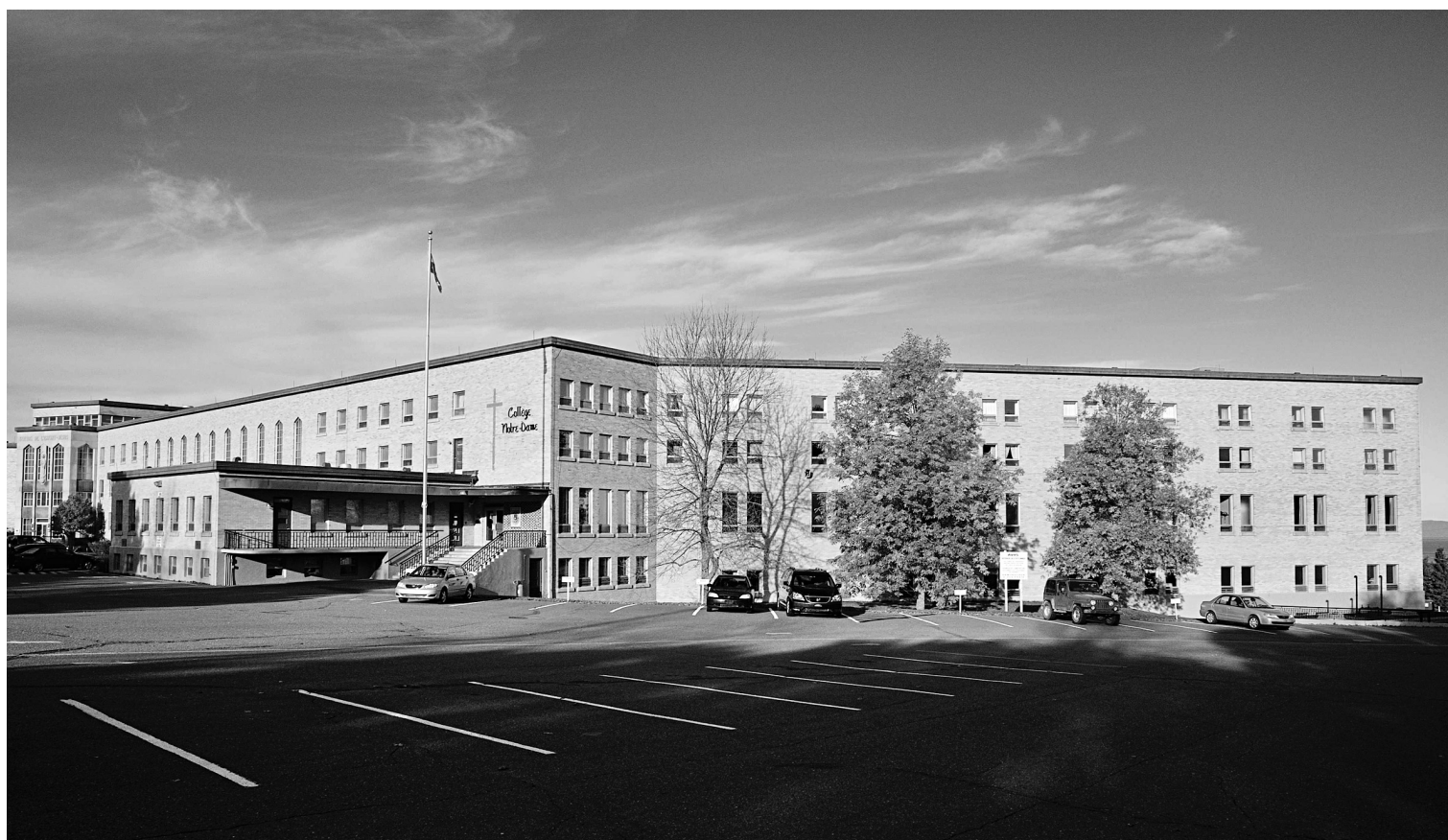
COLLÈGE NOTRE-DAME DE RIVIÈRE-DU-LOUP

Entamée depuis la fin des années 1960 et se poursuivant encore aujourd'hui, la relève institutionnelle est un processus qui vise la cession de la propriété des établissements d'enseignement privés des communautés religieuses à des organismes laïcs à but non lucratif. « Parfois, les communautés religieuses ont des besoins financiers plus grands qu'avant et elles doivent hausser leur prix de vente », explique M. St-