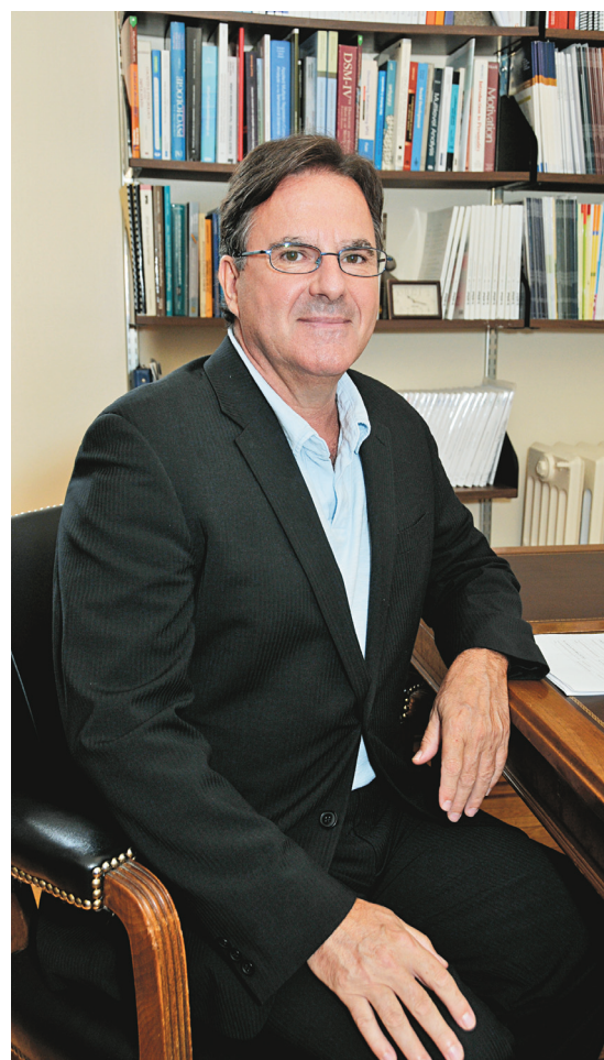
UNIVERSITÉ DE MONTRÉAL

« Lors d'une activité parascolaire, par exemple, ou en intégrant dans une classe pour une demi-