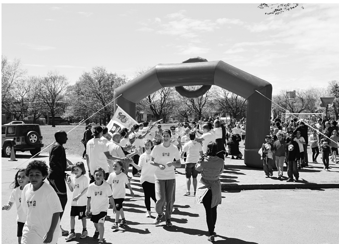
Les élèves du collège Stanislas ont relevé le défi d'une course à relais entre Montréal et Québec. Ce grand moment de camaraderie a lancé les festivités du 25 e anniversaire du campus à Québec.