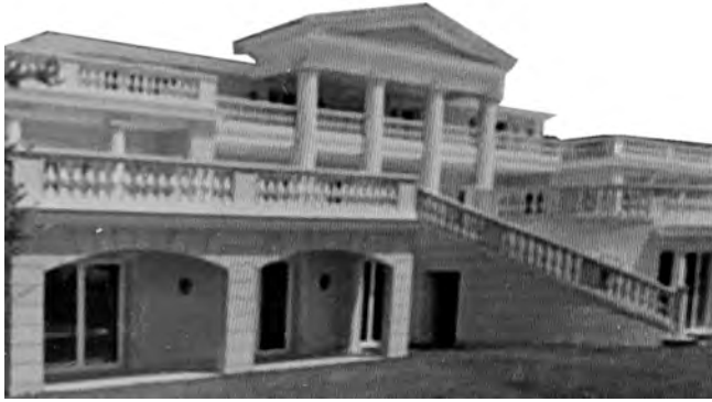
"Cette royale demeure prenait des airs d'hôtel particulier avec ses quatre colonnes ioniennes surmontées d'une architrave sculptée de motifs gréco-romains." Les tringles, p.10