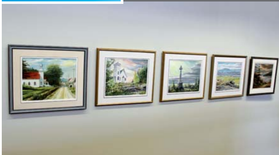
Six tableaux signés Eudor Jean Vézina.