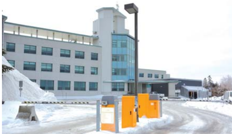
La guérite à l'hôpital de Montmagny.

Comme il doit assurer l'autofinancement de tout ce dossier, le CISSS justifie ces augmentations par la nécessité de se constituer une réserve pour la réfection future des stationnements. «À Montmagny,