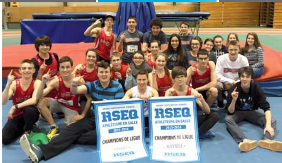
BV Les Wisigoths du Collège de Sainte-Anne-de-la-Pocatière se sont illustrés en athlétisme en salle.

On devra attendre le dernier match pour connaître le tableau des séries. Prochaine rencontre le 4 mars à 20h30. (D.G.)