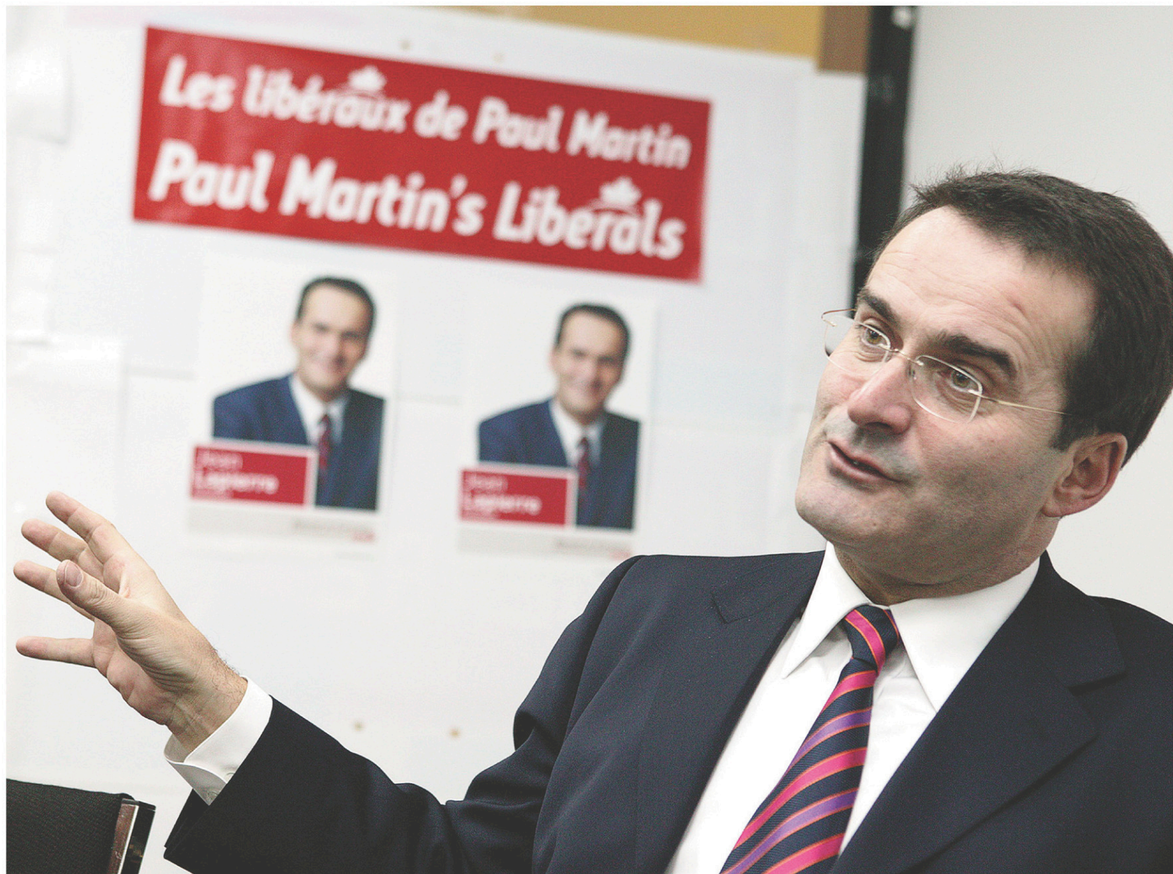
Jean Lapierre en janvier 2006, alors qu'il faisait campagne pour être réélu député d'Outremont.