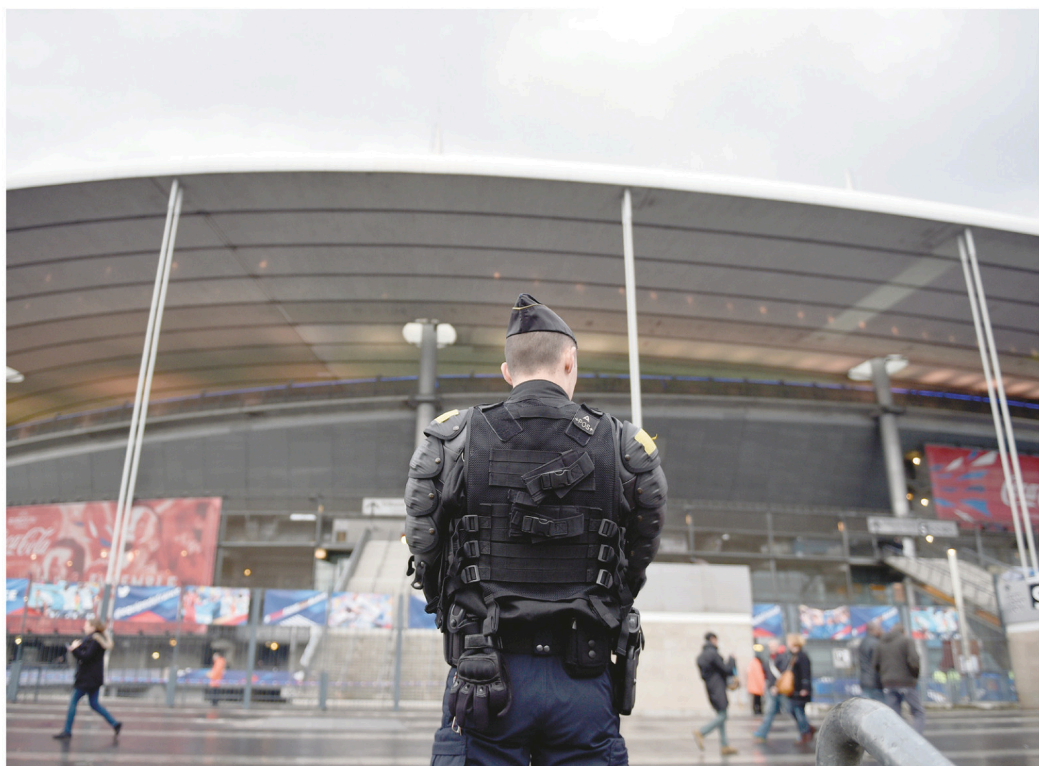
Les policiers étaient nombreux mardi aux abords du Stade de France lors du match amical entre la France et la Russie.