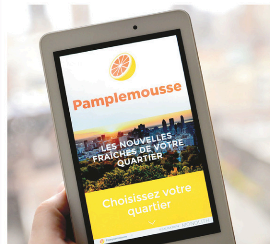
OLIVIER ZUIDA LE DEVOIR

Ces chercheurs devraient commencer par se demander pourquoi leur libéralisme extrême et leur démocratie à l'américaine permettent actuellement l'émergence d'un politicien radical comme Trump... Ils seraient plus utiles.