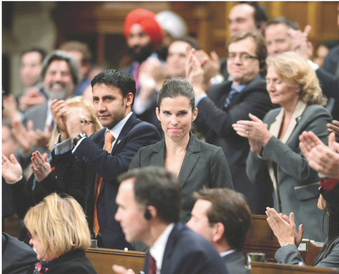
La ministre Kirsty Duncan, applaudie par ses collègues libéraux en décembre dernier

« Les chercheurs sentaient l'ingérence du gouvernement précédent, et ils avaient l'impression qu'on ne financerait leur projet que s'il impliquait une application commerciale », explique-t-elle. Et cette impression était probablement juste, car à partir de 2006, 9 % du budget du CRSH étaient attribués sous forme de subventions conditionnelles à l'engagement d'un partenaire privé. Ces subventions conditionnelles ne sont accordées qu'aux chercheurs qui se sont associés à une entreprise qui financera une partie de leur projet. En 2015-2016, 37 % du budget du CRSH était consacré aux subven-