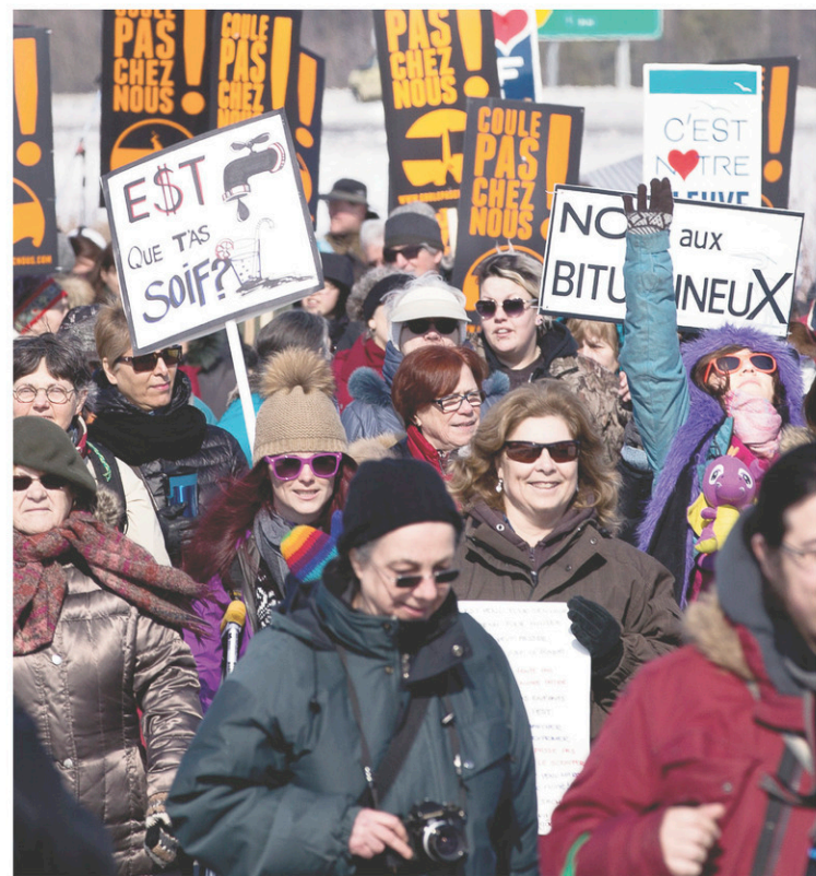
Manifestation contre le projet d'oléoduc Énergie Est de TransCanada à Sorel-Tracy, le 7 mars dernier

EN COLLABORATION AVEC L'INSTITUT DES TROUBLES D'APPRENTISSAGE