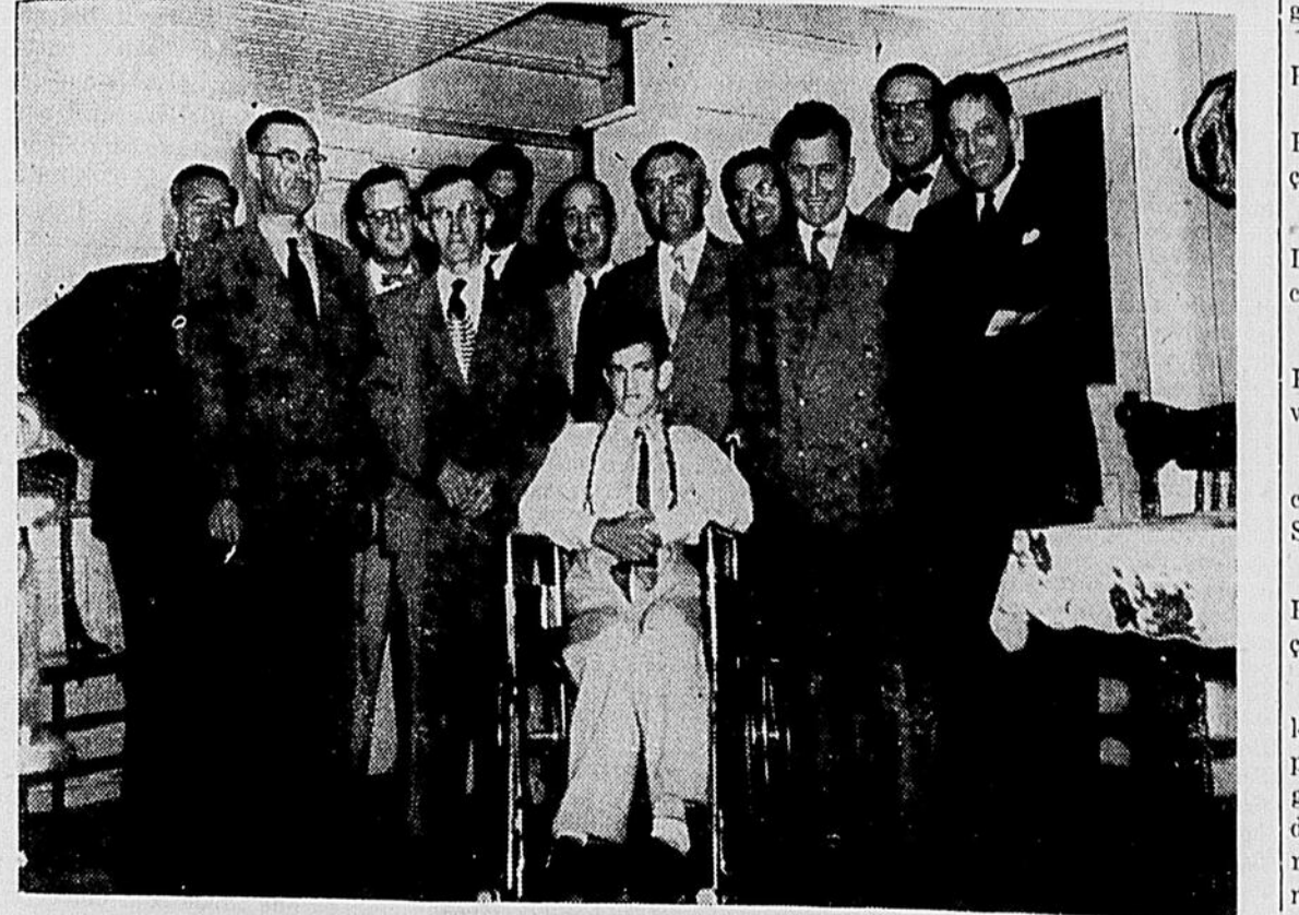
L'une des chaises roulantes offerte à un enfant infirme, par le Club Richelieu.