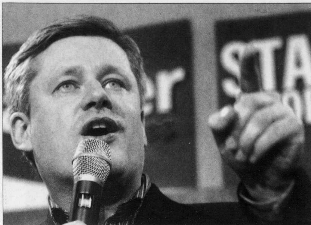
J.P. MOCZULSKI REUTERS