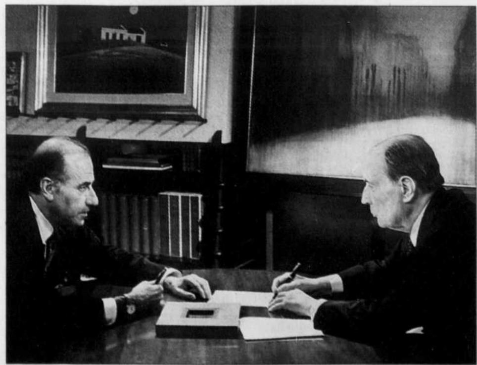
Le président François Mitterrand (à droite) s'entretient avec le journaliste de la Cinq Jean-Pierre Elkabbach, avant de répondre à ses questions, le 10 novembre 1991, dans son appartement privé du Palais de l'Élysée.