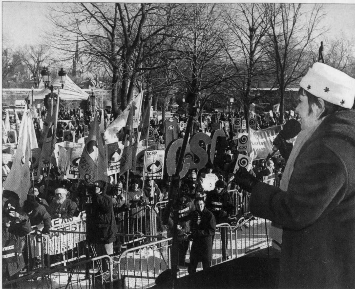
Les syndiqués des centres de la petite enfance et de la fonction publique ont manifesté en décembre contre l'adoption d'une loi spéciale.