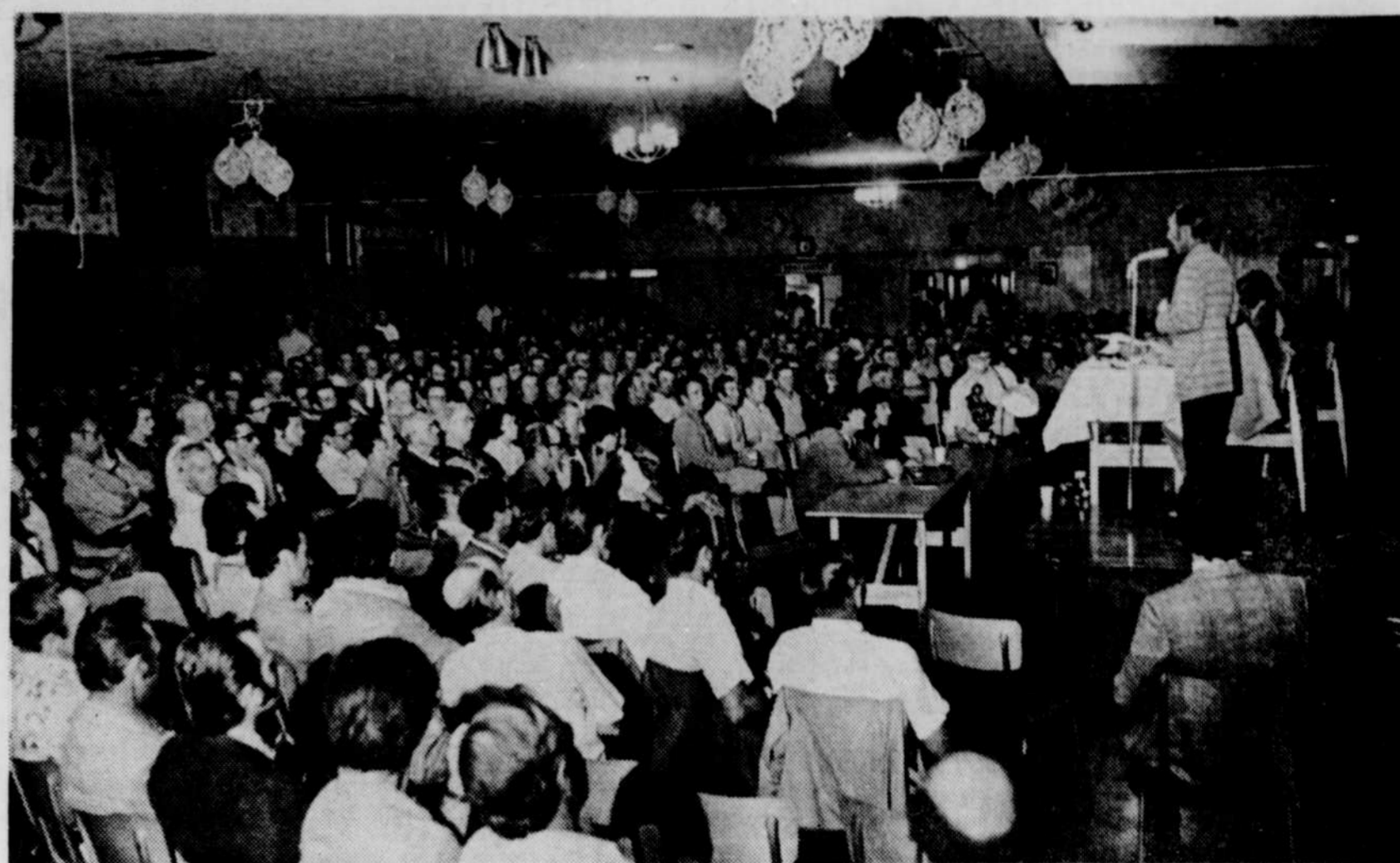
Plus de 600 agriculteurs de la région du centre du Québec se sont réunis à Saint-Cyrille, dans le comté de Drummond, jeudi soir, afin de prendre connaissance du bilan actuel de la situation et de proposer de nouvelles mesures susceptibles de leur venir en aide. Une assistance

Il faut que son conseil prenne une importance particulière à l'occasion de la réouverture des classes alors que des centaines de jeunes ont à circuler sur les voies publiques.