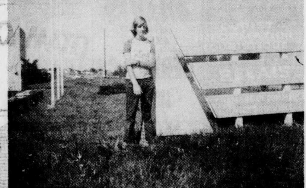
Le relais touristique à Arthabaska n'a obtenu cette année qu'un succès mitigé comparativement aux années passées. On peut voir (photo du haut) que seulement deux personnes discutaient calmement tout près de la rivière alors que quelques autres prenaient un "lunch"