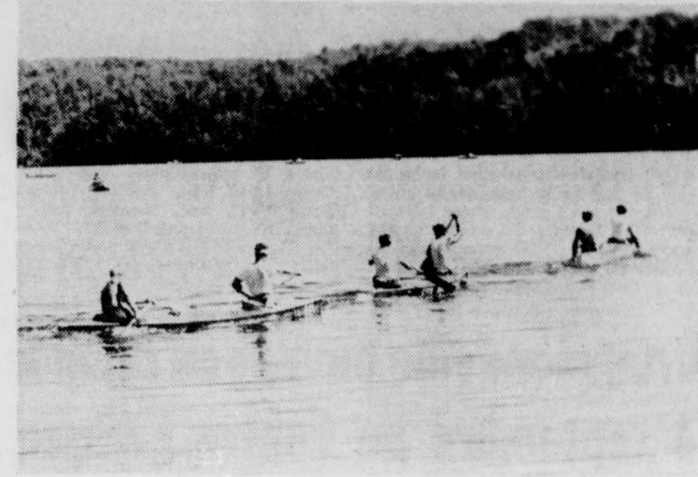
La classique de canot de La Mauricie se déroule dans un décor des plus enchanteurs dignes de la Mauricie. Nous en témoignons par cette photo.

ainsi le barrage hydro-électrique situé à proximité. Cette partie du parcours ne sera aucunement modifiée mais avant d'entreprendre le portage de leur canot ils se dirigeront vers le barrage de l'Hydro-Québec qu'ils longeront avant de revenir au point de débarquement habituel pour compléter ce sprint d'une longueur totale d'un mille et qui vaudra aux gagnants une bourse de $300.00, offerte par la firme Cadorette Canots Inc de Grand'Mère. Cette course contre la montre devrait durer une vingtaine de minutes et retardera d'autant l'arrivée des premières équipes en face du boulevard St-Maurice à Shawinigan, point d'arrêt de cette deuxième étape qui sera courue à compter de 10 h 30 en matinée le dimanche 3 septembre prochain depuis St-Roch-de-Mékinac.