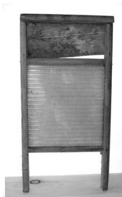
Planche à laver de Raymond Houde Photo de Robert Houde juin 2014

La planche à laver : Comment décrire ça. C'était une sorte de cadre rectangulaire en bois, dont les côtés étaient plus longs, pour former des pattes d'appui taillées au 45, dans la cuvette. Ce cadre retenait une surface en tôle ondulée ou en verre granulé à très gros grains (selon le niveau du budget ou le niveau d'exigence de celle qui l'utilisait) sur laquelle les femmes s'acharnaient à frotter les vêtements avec du savon du pays qu'elles fabriquaient elles-mêmes. Et le savon et la planche à laver réunis