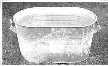
Cuvettes de Raymond Houde Photo de Robert Houde novembre 2013

prendre son bain ou donner le bain des enfants ou encore laver des vêtements avec la planche à laver.