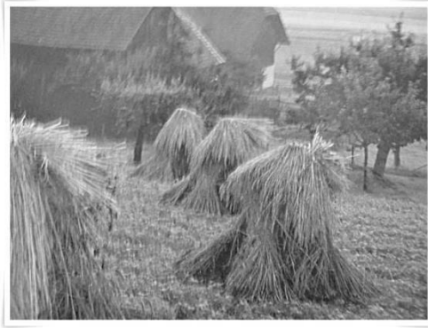
Photo d'un tableau au chalet de M. Jean-Yves Sylvestre à Cap-St-Ignace

Aujourd'hui, on dit des andins. Ils prenaient ensuite les fourches et faisaient des vailloches.