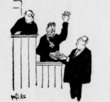
"C'est drôle à dire, mais je n'avais jamais juré avant de venir en cour".

Le projet, selon les données du ministère, comprend la fondation de la route elle-même ainsi qu'un pont et une jetée dans la baie de Matane.