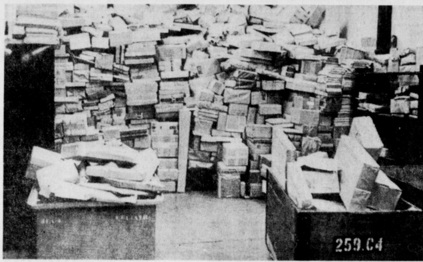
LE CONFLIT DES POSTES — A Montréal, le conflit des postes n'est pas encore réglé. Dans les entrepôts, les colis s'accumulent de jour en jour.

Un imposant cordon de sécurité et un hélicoptère de la police d'Etat du Massachusetts protégeaient le sénateur et son épouse, à la suite des menaces écrites qu'avaient reçues les organisateurs du défilé.