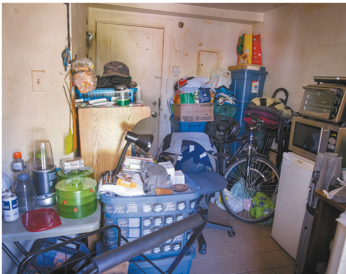
Tout ce que les chambreurs possèdent s'entasse évidemment dans l'unique pièce qu'ils occupent.

À Montréal, il est illégal de louer une chambre de moins de 9m 2 , sans lavabo et sans fenêtre. Le