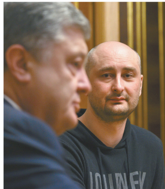
Le journaliste Arkadi Babtchenko en compagnie du président de l'Ukraine, Petro Porochenko