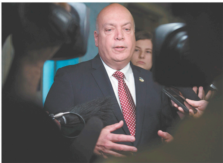
Robert Poëti avait perdu son poste de ministre des Transports en 2016 avant de devenir ministre délégué à l'Intégrité des marchés publics et aux Ressources informationnelles l'année suivante.