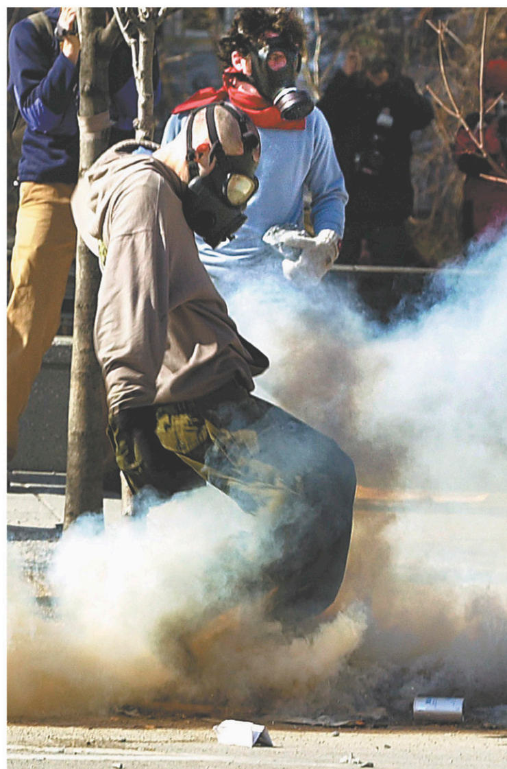
Le Sommet des Amériques, tenu à Québec en 2001, avait été marqué par plusieurs affrontements entre la police et des manifestants.

« Si vous êtes un commerçant ou un citoyen et que vous