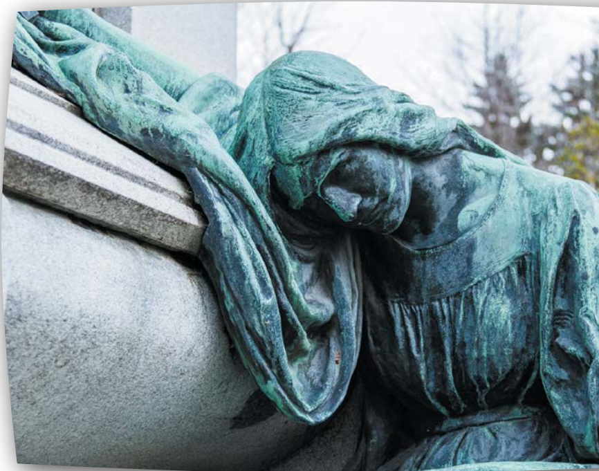
La pleureuse. Œuvre de Louis-Philippe Hébert, 1908.