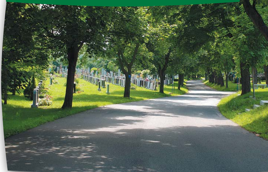
Vue des chemins de la section W

Il se trouve dans toute société des lieux de mémoire incontournables qui témoignent pourtant d'une histoire souvent trop facile à oublier. Les cimetières comptent parmi eux.