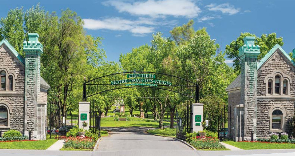
Entrée chemin de la Côte-des-Neiges