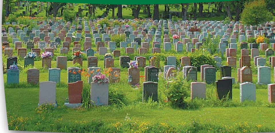
Vue de la section Notre-Dame

Préserver et mettre en valeur les monuments funéraires sont des actions indispensables pour la transmission du patrimoine. C'est dans cette perspective que la Ville de Montréal et le ministère de la Culture et des Communications, en collaboration avec les gestionnaires du cimetière, ont développé une approche pour la préservation des ornements métalliques. Les monuments se distinguent par leurs formes, leurs dimensions, mais surtout par la finesse des détails, soit sa couleur et son ornementation.