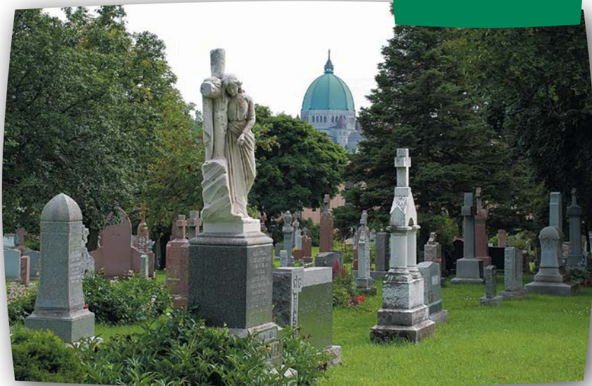
Vue de la section B