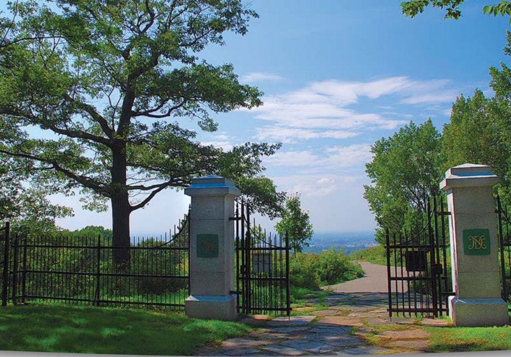
Entrée au sommet nord du mont Royal