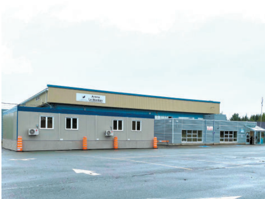
Les citoyens pourront répondre au sondage qui permettra d'établir leurs besoins en matière d'installations sportives.

S'ils vivent un enjeu technique avec la plateforme de sondage, les gens sont invités à suivre les indications sur le carton.