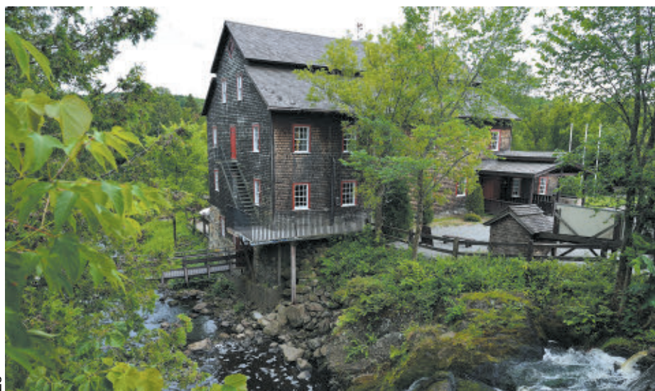
Le Moulin à laine entreprend officiellement sa saison estivale le 8 mai prochain.

Le Moulin à laine d'Ulverton est un site historique et patrimonial. Ce moulin à laine, construit en 1840, est le dernier moulin à laine encore fonctionnel au Canada. Il offre des visites guidées, des expositions et des activités pour toute la famille.