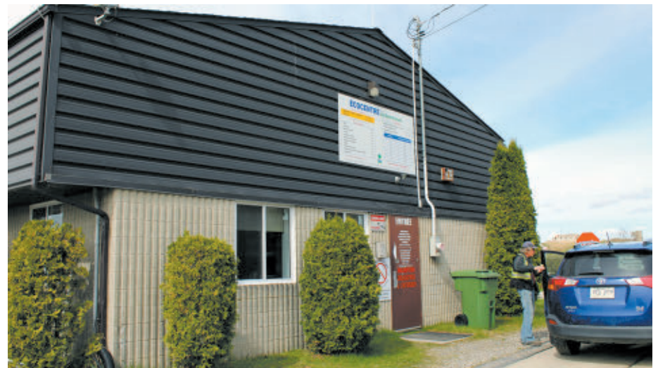
L'écocentre est ouvert du mercredi au samedi jusqu'au 28 novembre 2026.

Pour consulter l'horaire et les coordonnées de l'écocentre ou pour avoir des détails sur les matières acceptées, les citoyens peuvent consulter la section Matières résiduelles, puis Écocentres : www.val-saint-francois.qc.ca .