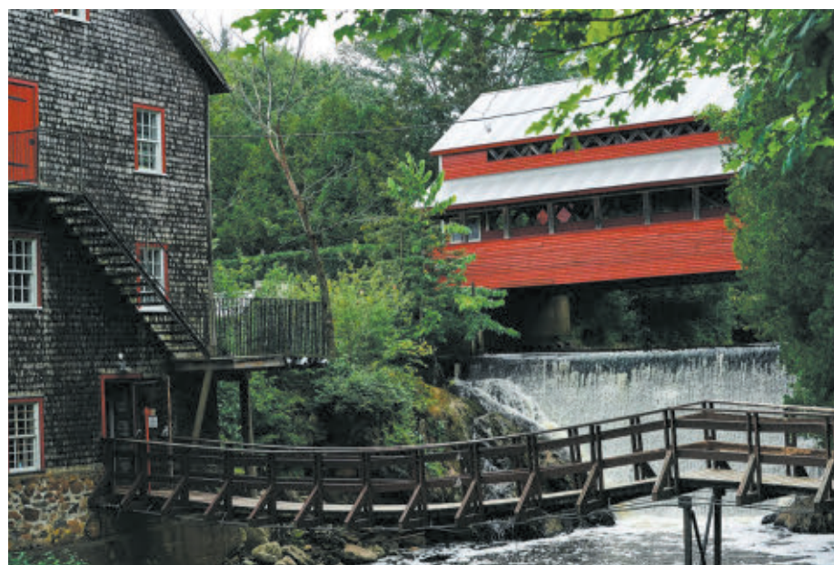
Dès l'automne, l'équipe en place pour la saison estivale 2026 présentera un spectacle nocturne immersif qui combine lumière, conte, musique et nature.

2 - Actualités - L'Éincelle • www.actualites-letincelle.com • mercredi 6 mai 2026