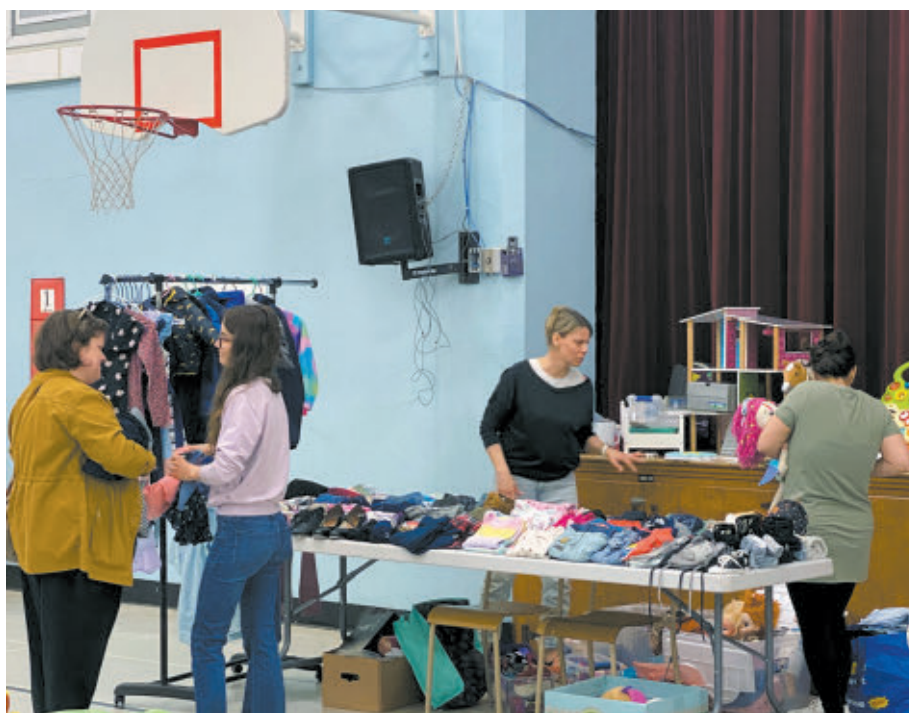
Le gymnase accueillera jusqu'à 40 tables proposant une variété d'articles usagés ainsi que des produits uniques offerts par des commerçants et entrepreneurs locaux.

Pour plus d'informations ou pour louer une table : 819 826-3737 ou sullivanm@edu.etsb.qc.ca