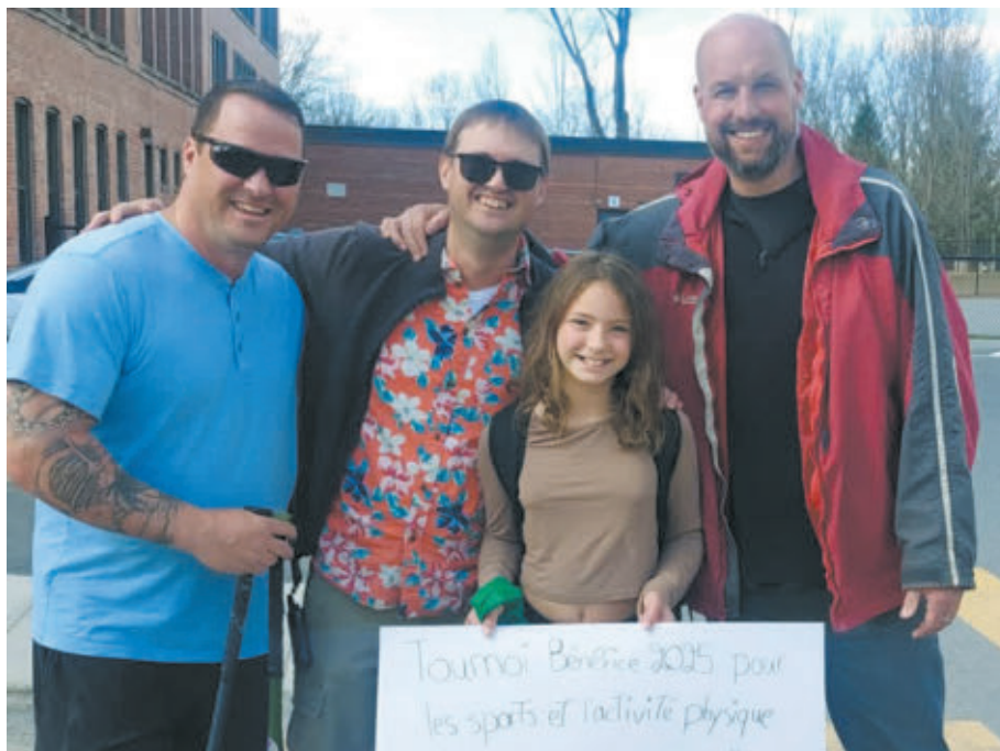
Les départements sportifs des écoles anglophones de Richmond ont bénéficié d'un appui financier l'ordre de 3343,25 $ chacun provenant de la 6 e édition du tournoi de balle lente mixte « Sport Equipment Benefit Tournament ».

secteurs sportifs des écoles anglophones richmondaises depuis sa création.