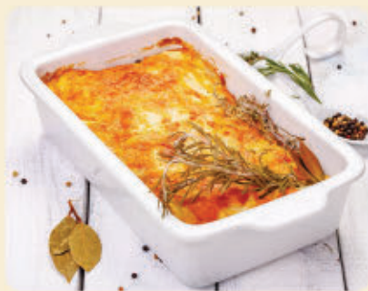
Pâtisson gratiné au fromage de chèvre