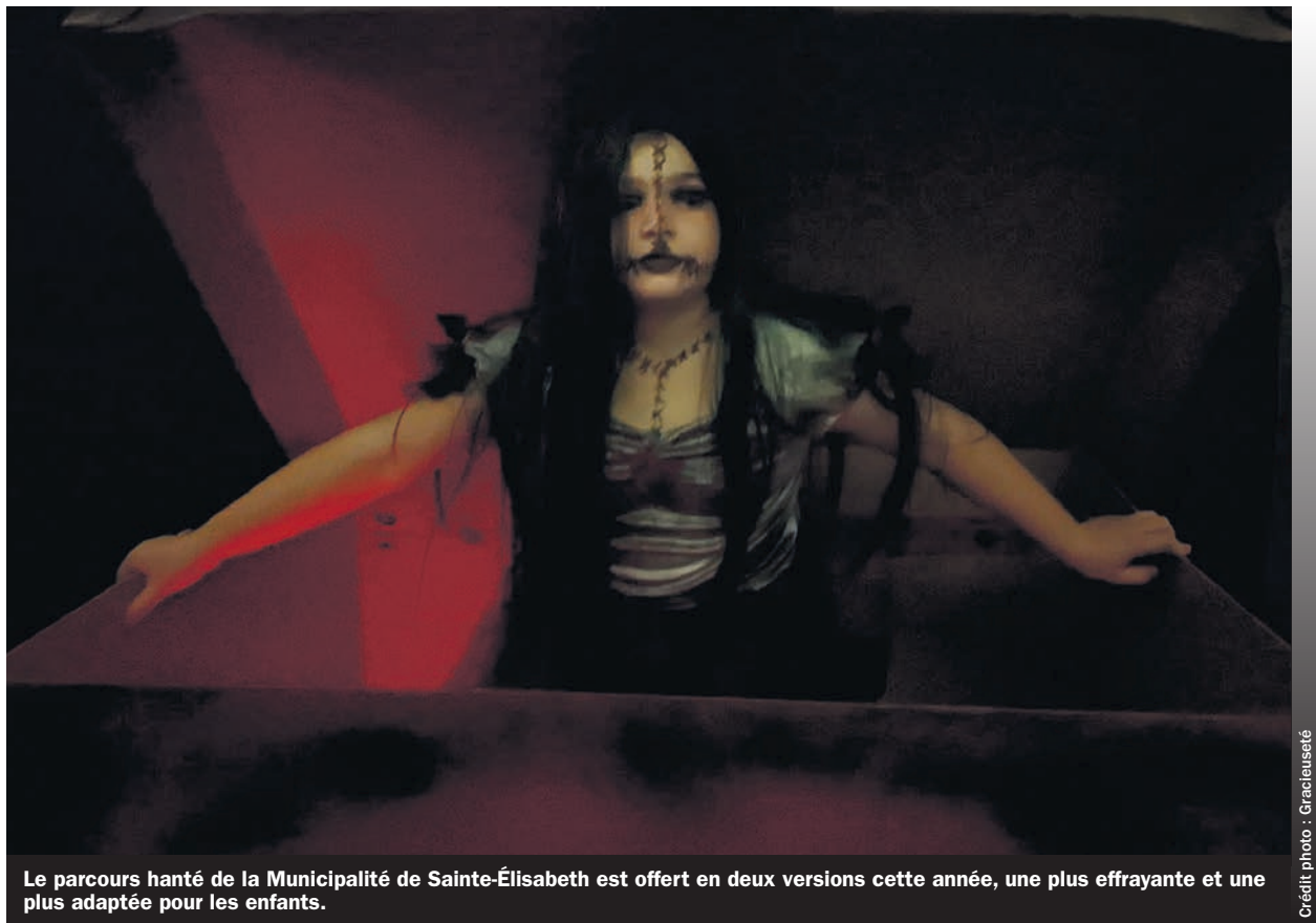
Le parcours hanté de la Municipalité de Sainte-Élisabeth est offert en deux versions cette année, une plus effrayante et une plus adaptée pour les enfants.