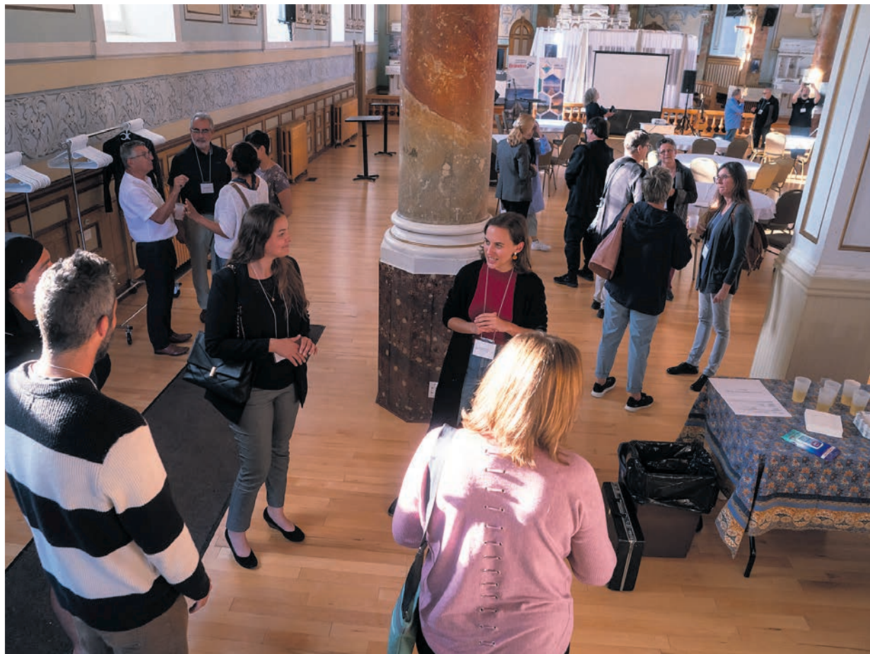
Le jeudi 26 octobre prochain sera présentée la troisième édition tant attendue de Carrefour Culture + affaires au Café Culturel de Lavaltrie.