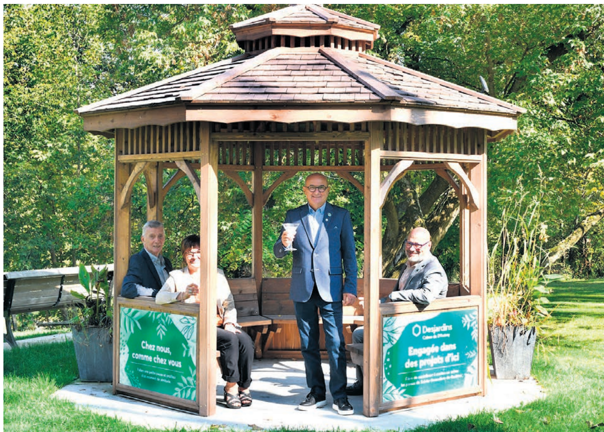
L'inauguration du tout nouveau gazébo de la halte du pont Grandchamp à Berthierville.