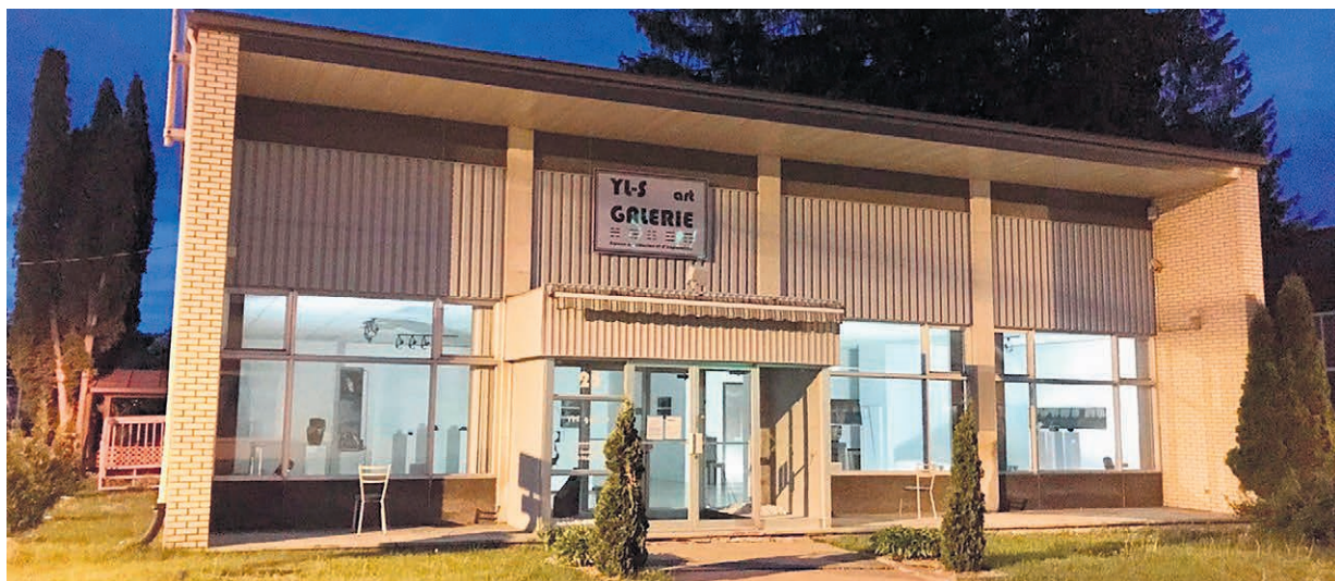
La Galerie YL-S.

La commissaire poursuit en déclarant que son choix s'est arrêté sur ces artistes parce qu'elles exploitent une variété de fibres naturelles issues des végétaux, plutôt que le tissu. Des matériaux tels que la paille, le fil de papier de lin et l'osier sont mis de l'avant.